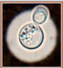
การสายนว