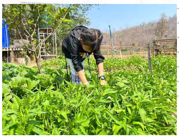
ลงมือ ปลูกของ จารวัตนเลข ชั้นบันทึก (ได้แก่คุณครูพิศพลทอง จารวัตนเลข)

กิจกรรมที่เห็นได้ชัดร่วมกันเพื่อน ๆ ในชั้นเรียนของหนูวันนี้ คือ หนูได้มา ช่วยกันเก็บผลผลิตจากของปลูกแล้ว ซึ่งพวกหนูได้เรียนรู้เกี่ยวกับการปลูกผักและ การดูแลผักจนถึงเวลาเก็บนำมาปรุงรสอาหาร พวกหนูได้เรียนรู้ วิธีการดูแลผักและระยะเวลาในการเจริญเติบโตของผักที่ปลูกโดย ใช้เวลา ๕๕-๕๐ วัน หนูได้เรียนรู้ความรับผิดชอบที่หนูทำกับผักการ ทำงานร่วมกับพี่และความสำเร็จของการเจริญเติบโตของผัก ซึ่งหนู ก็มีความสุขที่ได้เห็นโตงผักปลูกแล้วที่ของหนูของหนูต่างน้ำและเห็น พวกหนูในโรงเรียนจากมูลนิธิ และกำลังตั้งพี่ที่เงินมาปลูกผักของ พวกหนูที่มีใจมากกับประสพความสำเร็จ การปลูกผักครั้งนี้ จากประสพ ความสำเร็จ เห็นการเจริญที่ช่วยพัฒนาการปลูกผักของหนูให้ดีกว่าเดิมยิ่ง ขึ้นต่อ