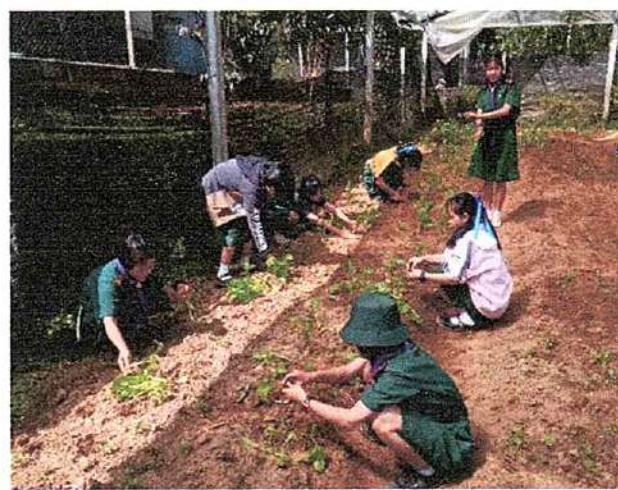
ภาพที่ ๔ กิจกรรมปลูกรัก