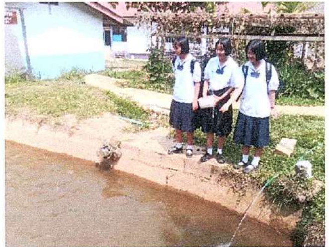
ภาพที่ ๒ กิจกรรมให้อาหารปลา