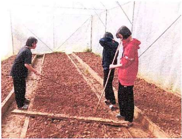
ภาพที่ ๑ กิจกรรมชุดแปลงผัก