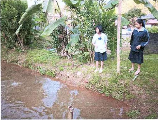
ภาพที่ ๑ กิจกรรมให้อาหารปลา