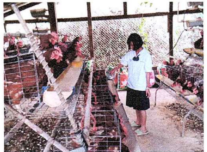
ภาพที่ ๓ กิจกรรมให้อาหารไก่