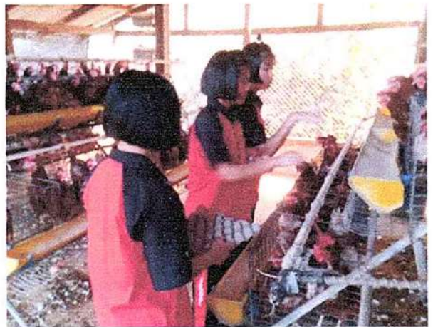
ภาพที่ ๔ กิจกรรมเก็บไข่ไก่