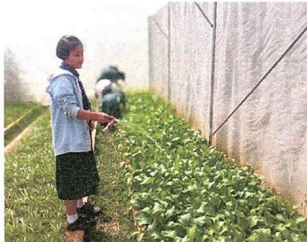
ภาพที่ ๒ กิจกรรมรดน้ำผัก