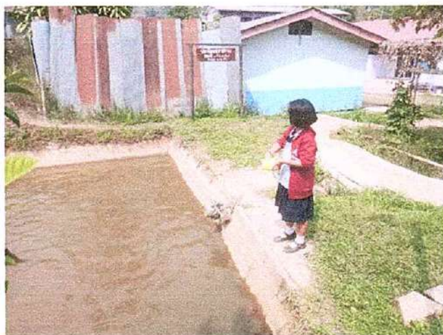
ภาพที่ ๒ กิจกรรมเลี้ยงปลา