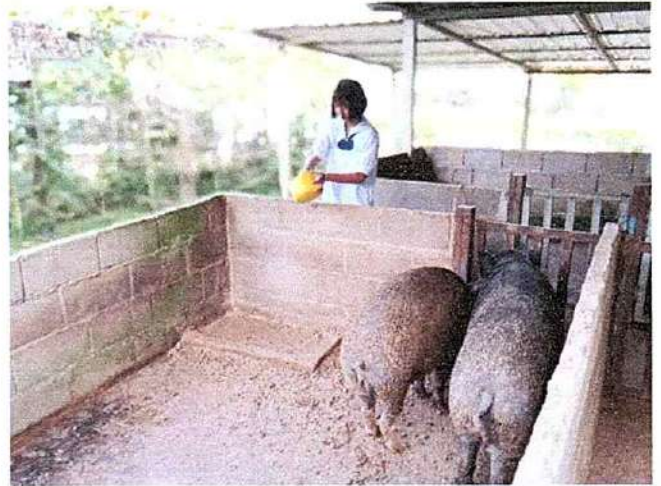
ภาพที่ ๒ กิจกรรมให้อาหารหมู