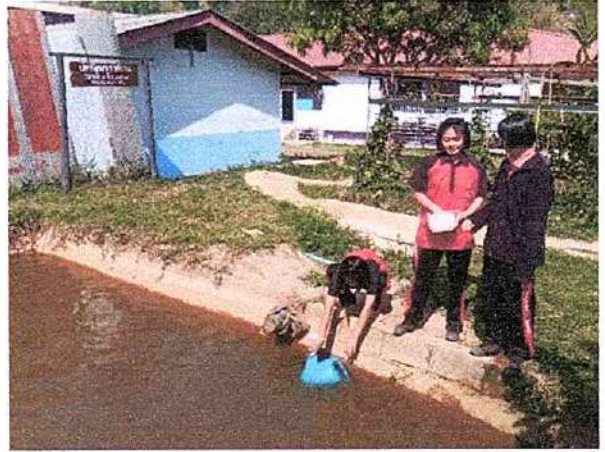
ภาพที่ ๒ กิจกรรมให้อาหารปลา