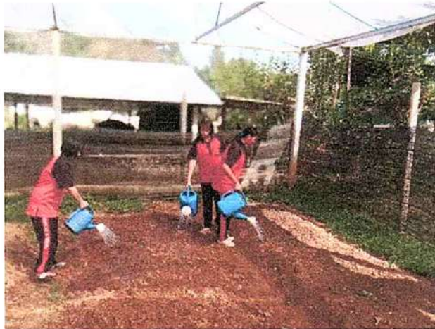
ภาพที่ ๓ กิจกรรมรดน้ำผัก