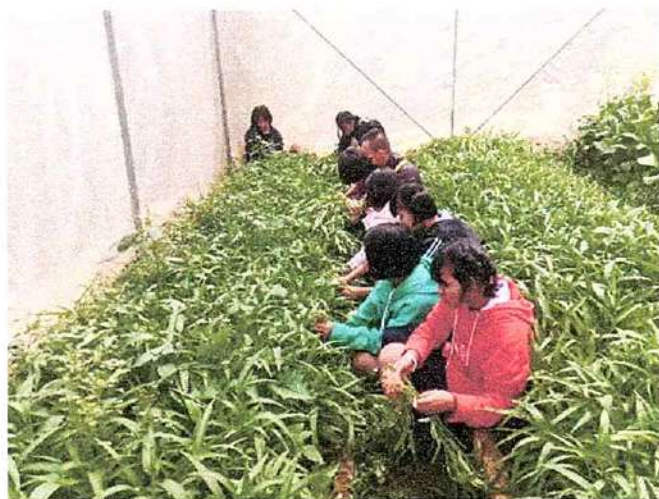
ภาพที่ ๑ กิจกรรมเก็บผักบุ้ง