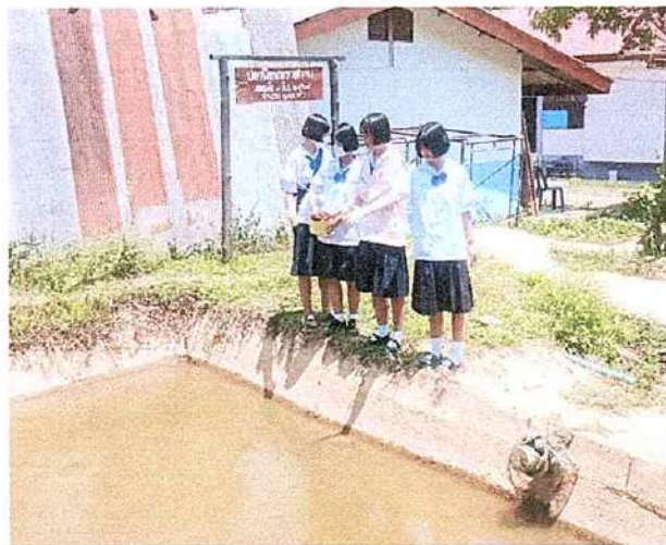
ภาพที่ ๒ กิจกรรมให้อาหารปลา