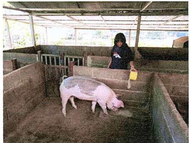
ภาพที่ ๓ กิจกรรมให้อาหารหมู