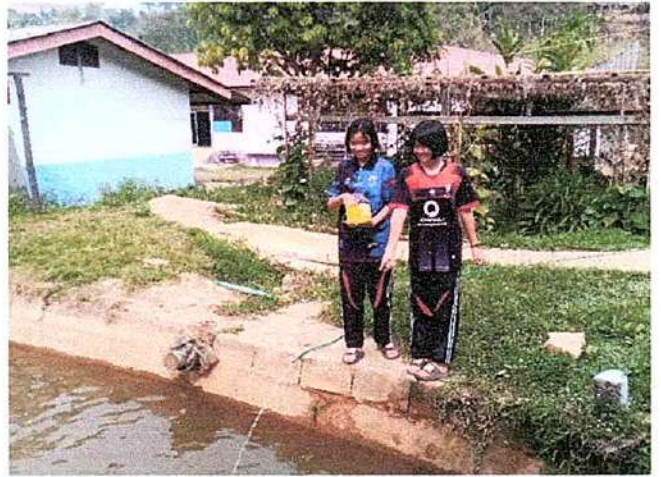
ภาพที่ ๒ กิจกรรมให้อาหารปลา