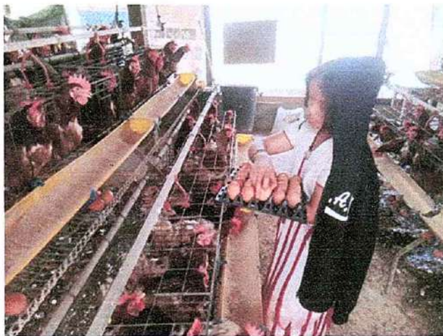
ภาพที่ ๓ กิจกรรมเก็บไข่ไก่