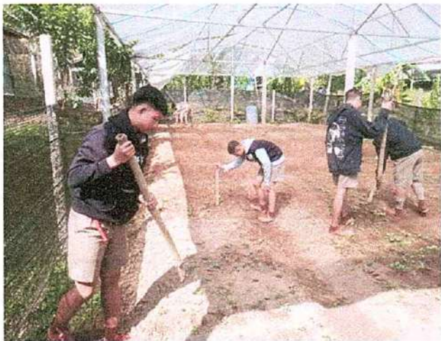
ภาพที่ ๑ กิจกรรมขุดแปลงผัก