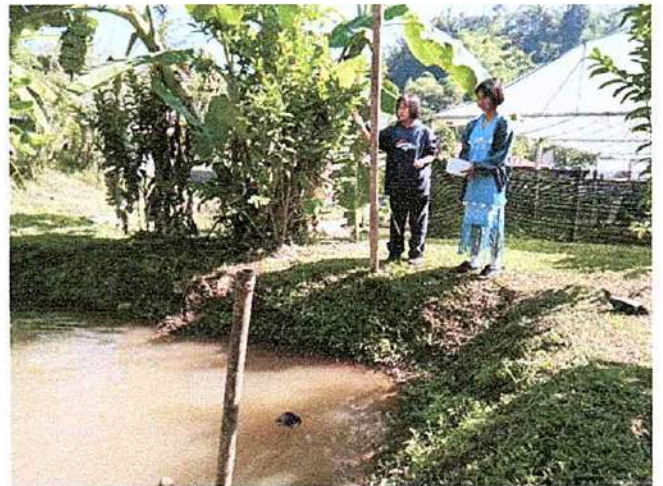
ภาพที่ ๒ กิจกรรมให้อาหารปลา