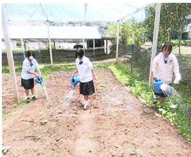
ภาพที่ ๓ กิจกรรมรดน้ำผัก