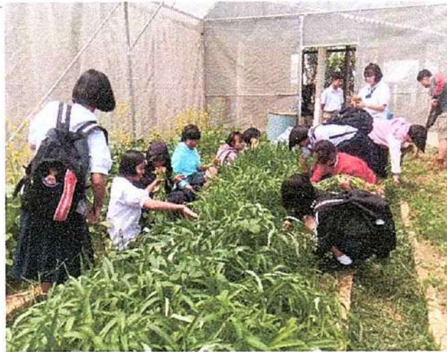
ภาพที่ ๑ กิจกรรมเก็บผักบุ้ง