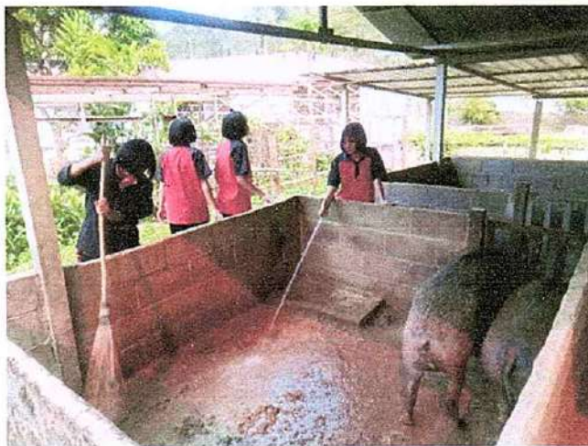
ภาพที่ ๓ กิจกรรมล้างคอกหมู