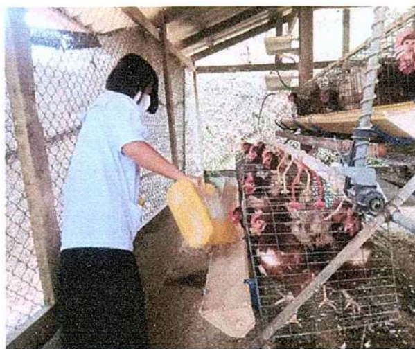
ภาพที่ ๔ กิจกรรมให้อาหารไก่