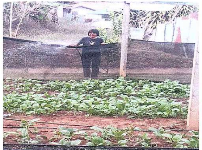
ภาพที่ ๔ กิจกรรมรดน้ำผัก