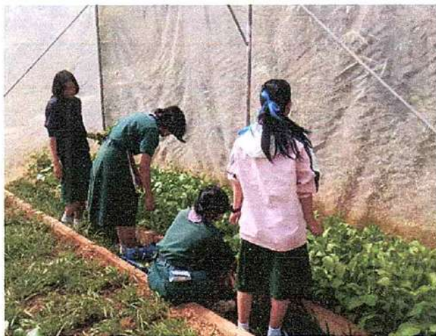
ภาพที่ ๓ กิจกรรมถอนต้นกล้าผัก