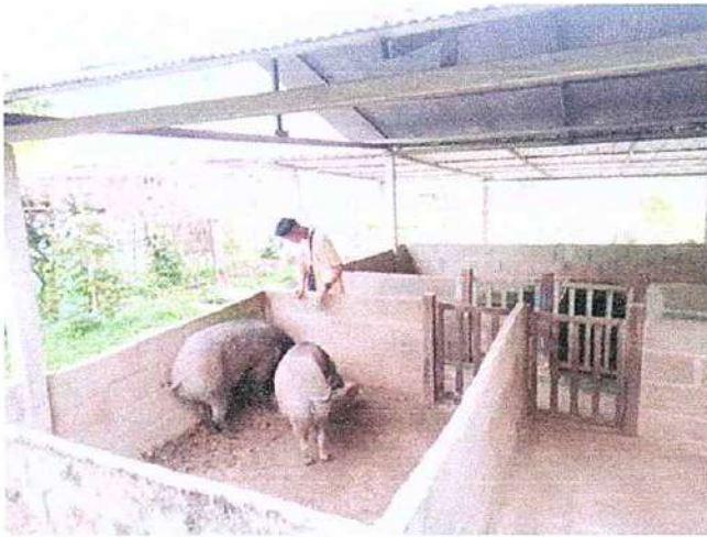
ภาพที่ ๑ กิจกรรมให้อาหารหมู