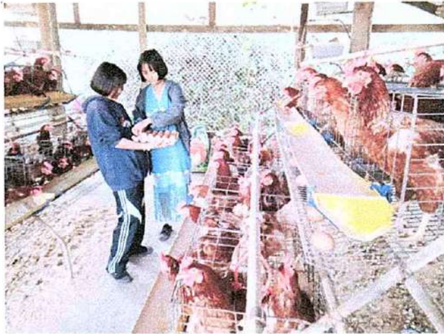
ภาพที่ ๑ กิจกรรมเก็บไข่ไก่