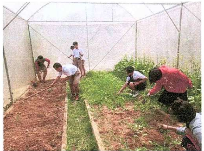
ภาพที่ ๔ กิจกรรมถอนหญ้า