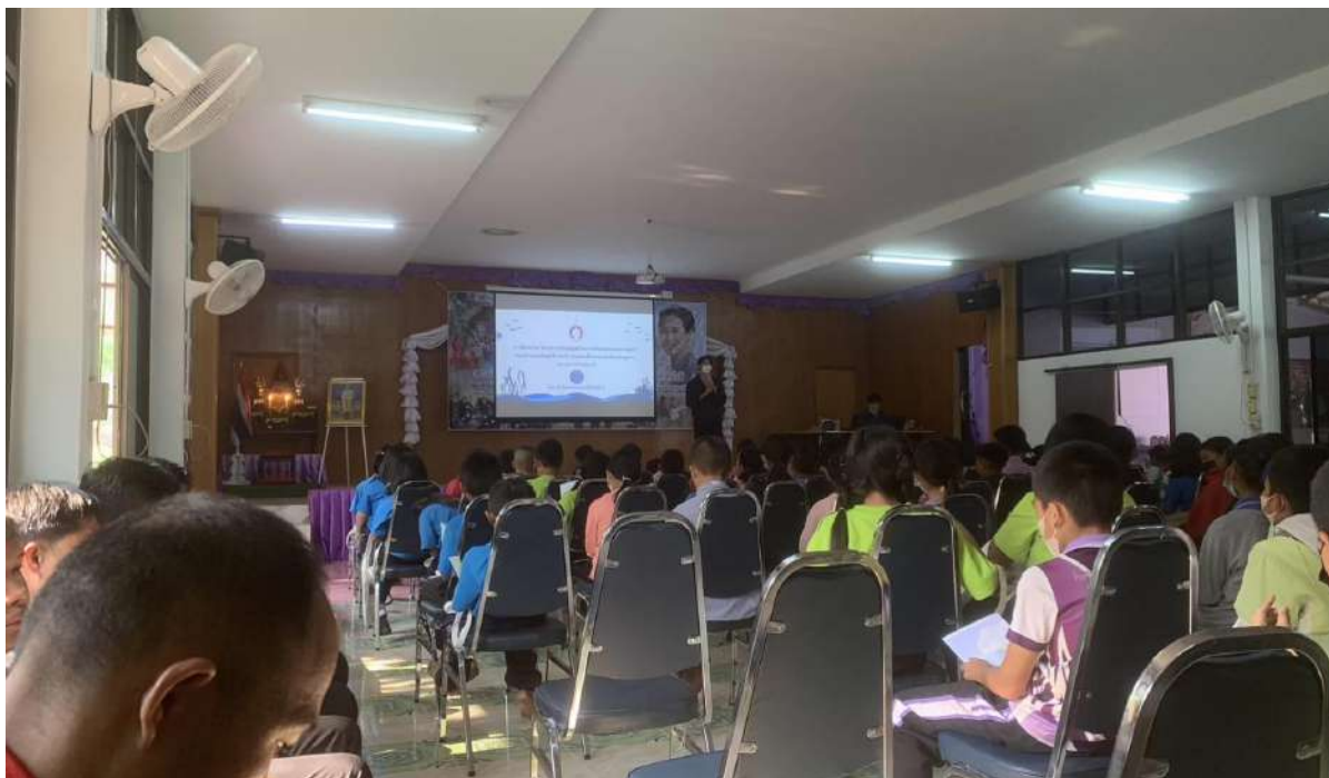
รูปกิจกรรมวันที่ 23 มีนาคม 2566