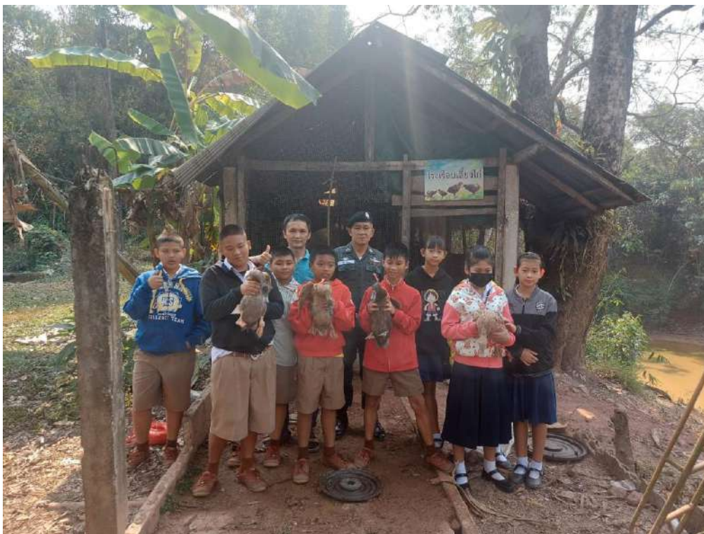
รูปกิจกรรมวันที่ 28 กุมภาพันธ์ 2566