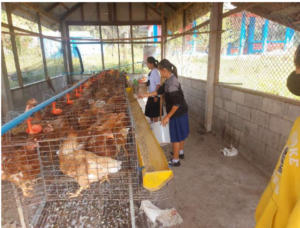
รูปกิจกรรมวันที่ 28 กุมภาพันธ์ 2566