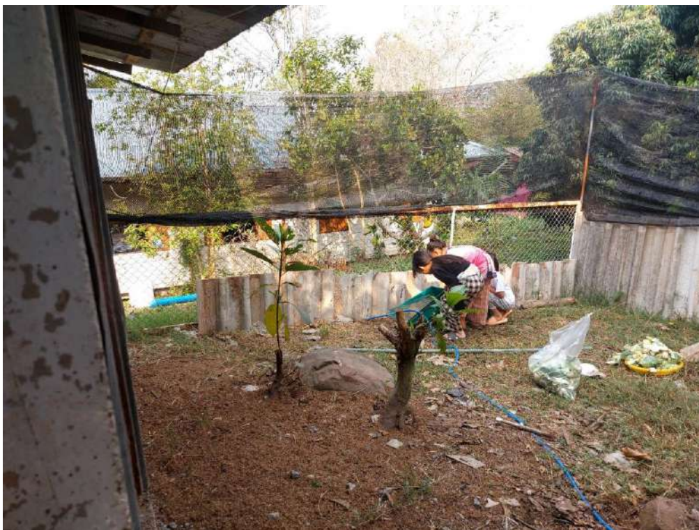
รูปกิจกรรมวันที่ 16 มีนาคม 2566