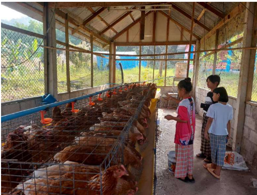
รูปกิจกรรมวันที่ 16 มีนาคม 2566