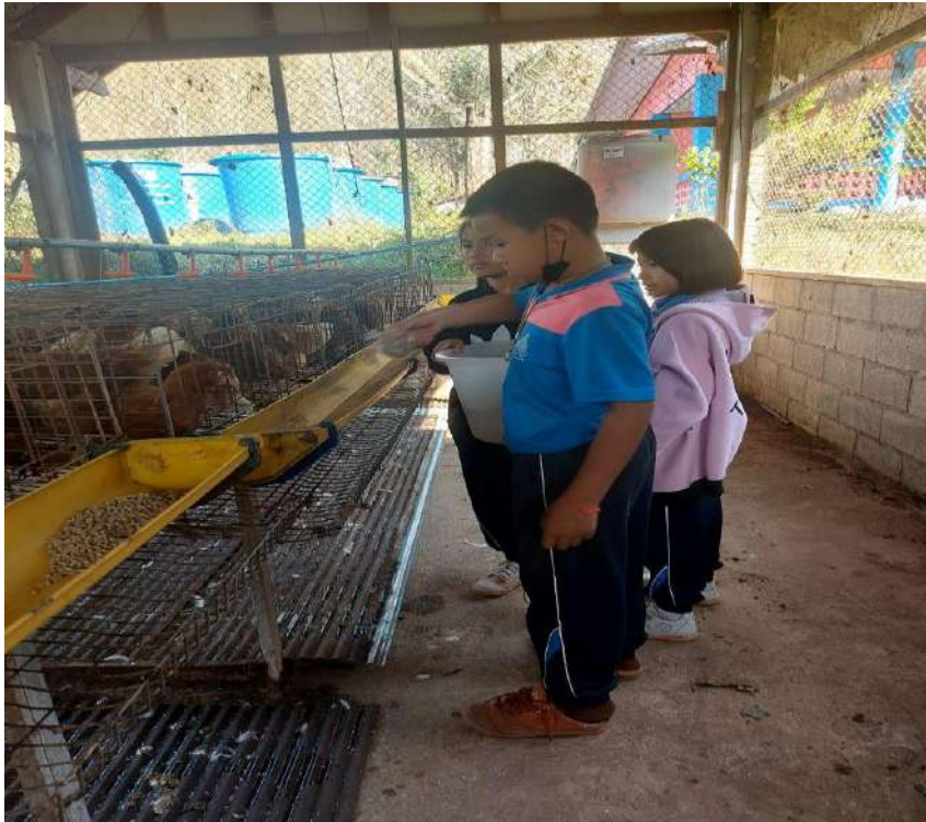
รูปกิจกรรมวันที่ 23 มีนาคม 2566