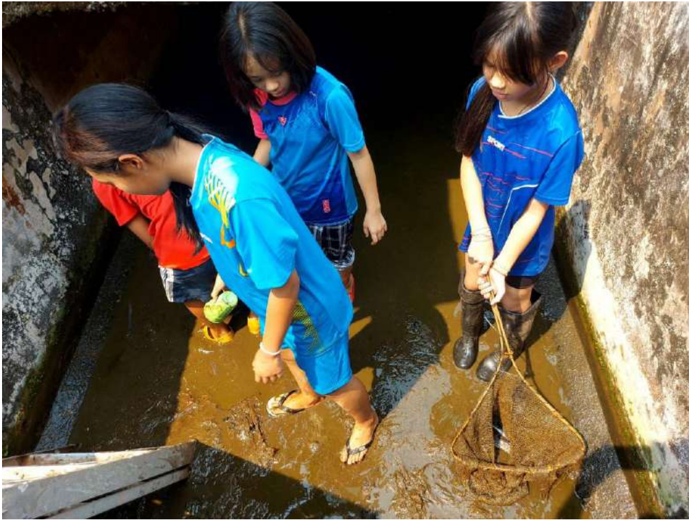
รูปกิจกรรมวันที่ 25 มีนาคม 2566