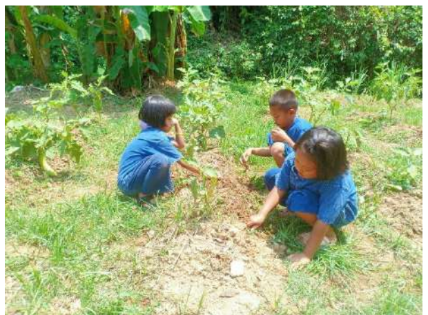
เด็กหญิงเยาวลักษณ์ อารีหนู นักเรียนชั้นประถมศึกษาปีที่ ๓