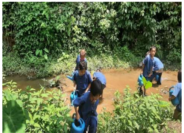
เด็กขายนันทพ สุวรรณภูมิ นักเรียนชั้นประถมศึกษาปีที่ ๒