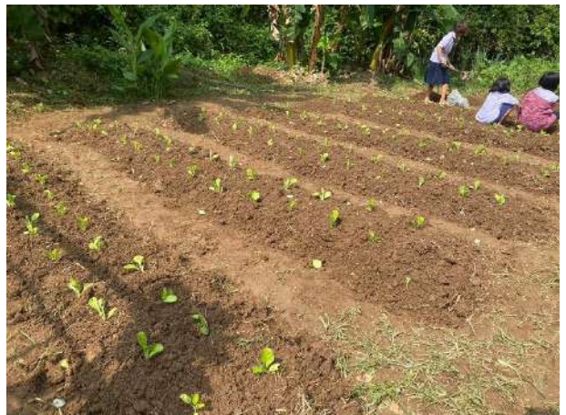
เด็กหญิงศุภิสรา หอมดอก นักเรียนชั้นประถมศึกษาปีที่ ๖