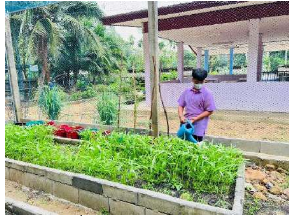
ภาพที่ ๒ รดน้ำผักสวนครัว