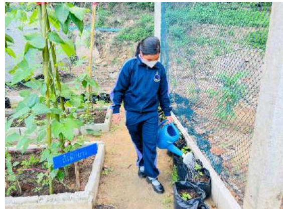
ภาพที่ ๔ รดน้ำผักสวนครัว