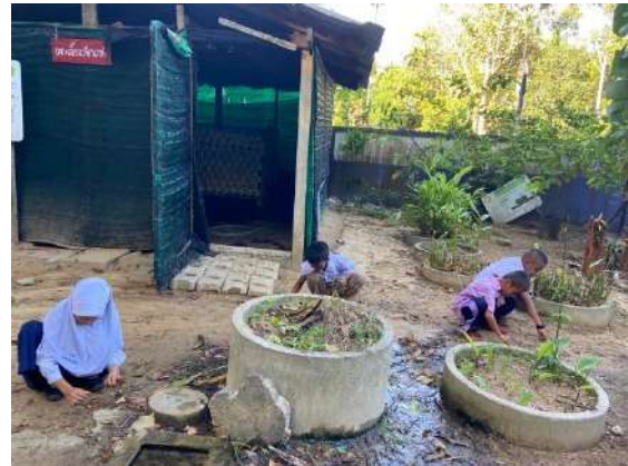
ภาพที่ ๔ กำจัดวัชพืชบริเวณรอบๆ โรงเรียน