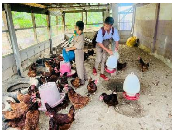
ภาพที่ ๔ ให้น้ำและอาหารไก่ไข่พันธุ์พระราชทาน