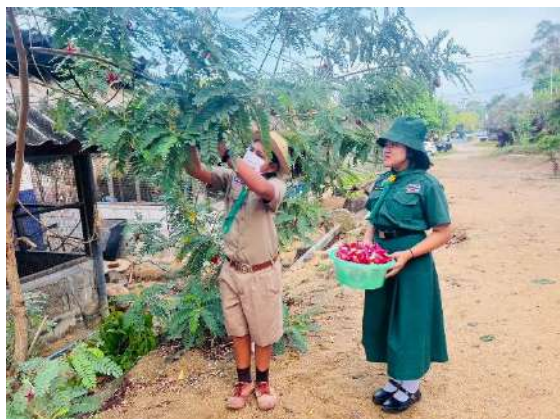
ภาพที่ ๑ เก็บดอกแคจำหน่ายผ่านสหกรณ์โรงเรียน