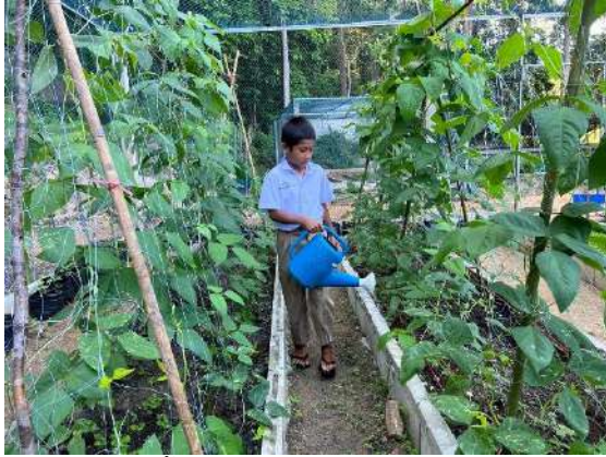
ภาพที่ ๑ รดน้ำผักสวนครัว