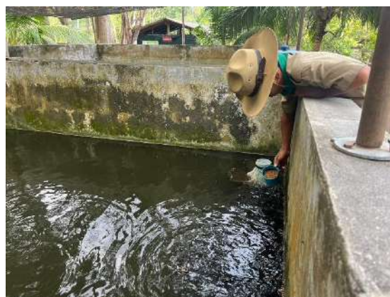
ภาพที่ ๖ ให้อาหารปลาตก