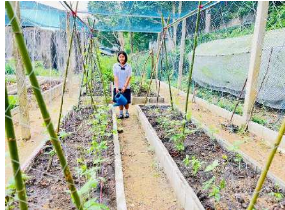
ภาพที่ ๔ รดน้ำผักสวนครัว