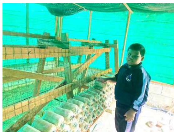
ภาพที่ ๖ จัดเรียงก้อนเชื้อเห็ดในโรงเรือน