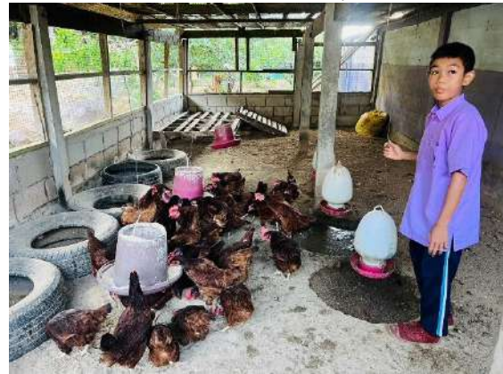
ภาพที่ ๖ ให้น้ำและอาหารไก่ไข่พันธุ์พระราชทาน