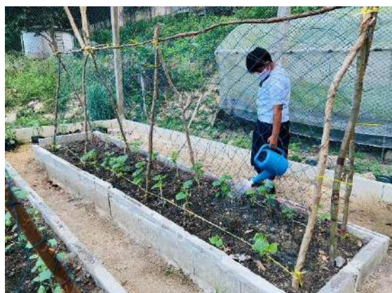
ภาพที่ ๓ รดน้ำผักสวนครัว