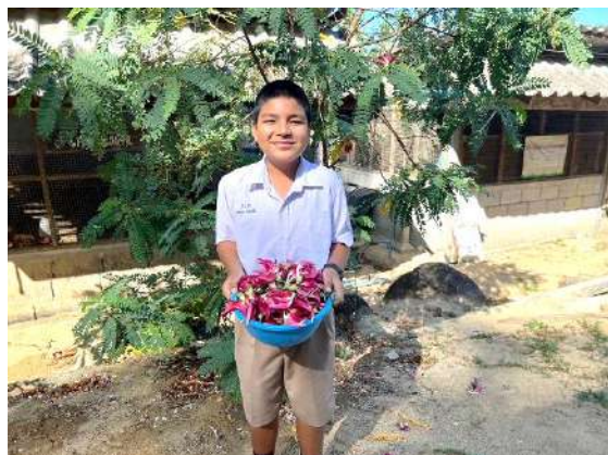
ภาพที่ ๑ เก็บดอกแคเพื่อจำหน่ายสหกรณ์โรงเรียน