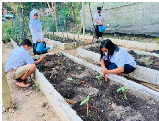
ภาพที่ ๒ พรวนดิน ใส่ปุ๋ย ถั้วฝักยาว