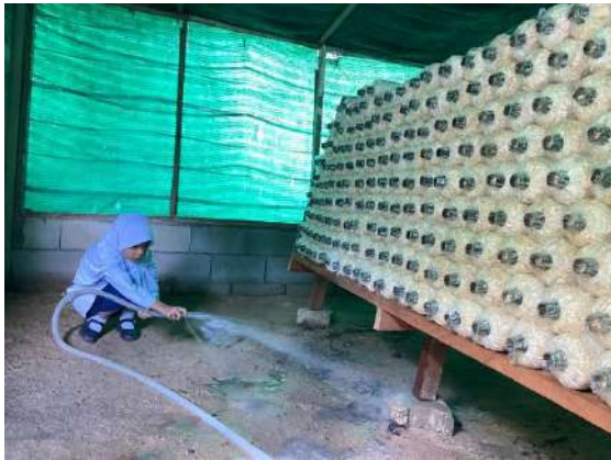
ภาพที่ ๕ รดน้ำพื้นโรงเรือนเพาะเห็ด