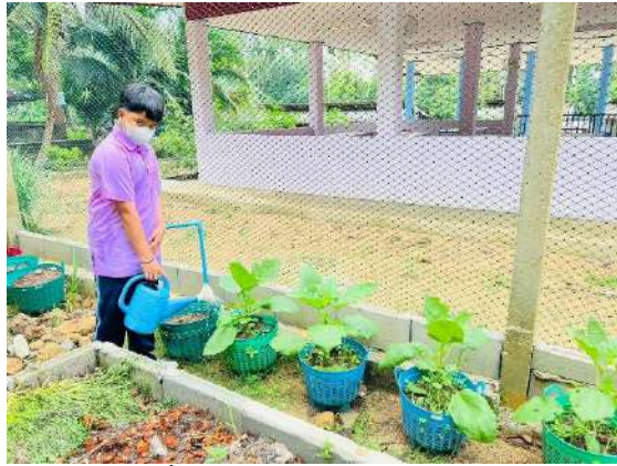
ภาพที่ ๑ รดน้ำผักสวนครัว