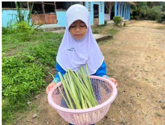
ภาพที่ ๓ เก็บตะาะไคร้