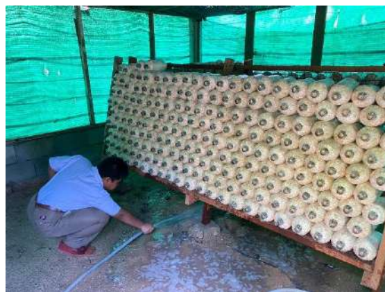
ภาพที่ ๔ รดน้ำพื้นโรงเรือนเพาะเห็ด