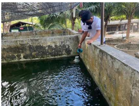
ภาพที่ ๕ ให้อาหารปลาตุ๊ก