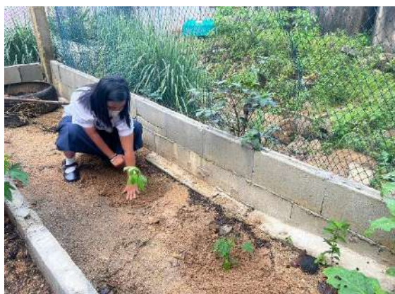
ภาพที่ ๓ ปลูกมะละกอ