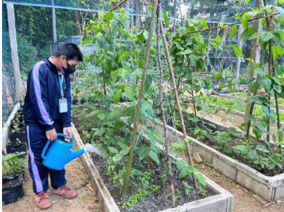
ภาพที่ ๑ รดน้ำผักสวนครัว