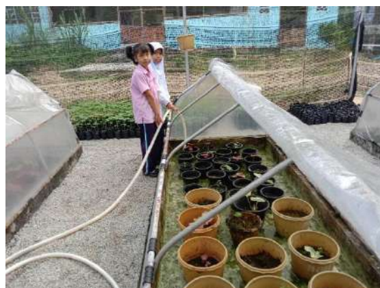
ภาพที่ ๖ เติมน้ำในแปลงบอนสี