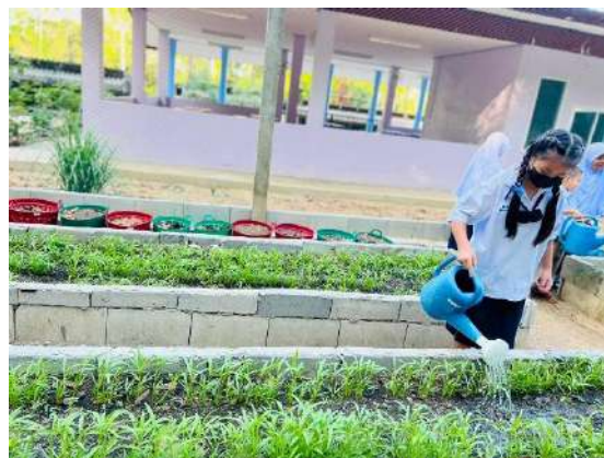
ภาพที่ ๒ รดน้ำผักสวนครัว