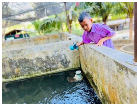
ภาพที่ ๔ ให้อาหารปลาถูก