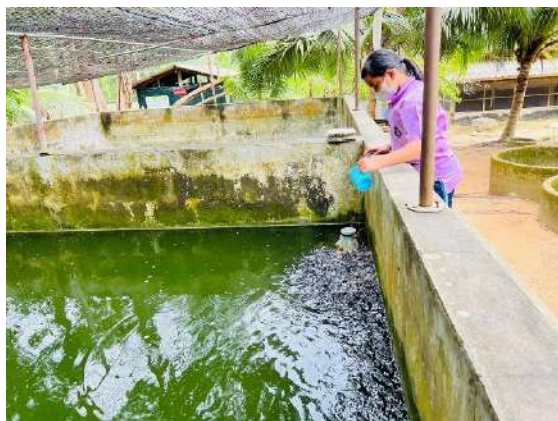
ภาพที่ ๕ ให้อาหารปลา