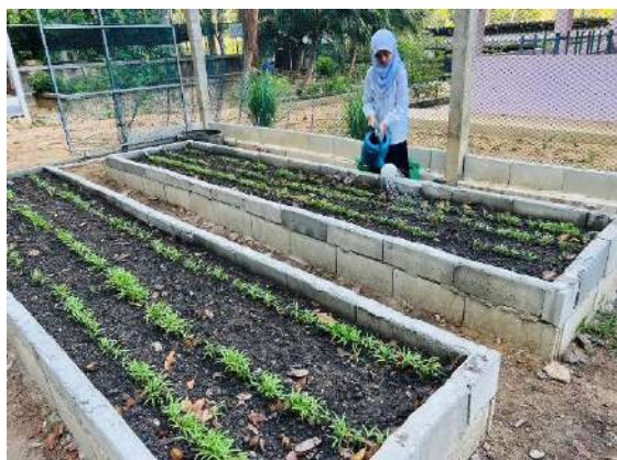
ภาพที่ ๓ รดน้ำผักสวนครัว