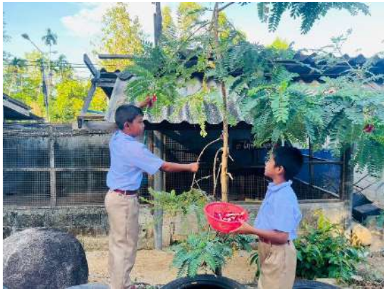
ภาพที่ ๓ เก็บดอกแคจำหน่ายผ่านสหกรณ์โรงเรียน