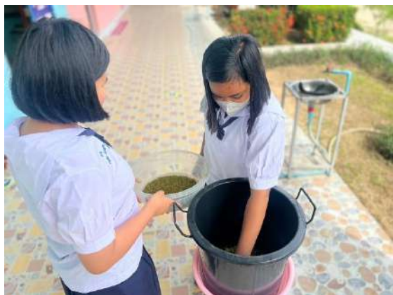
ภาพที่ ๑ เพาะถั่วงอก