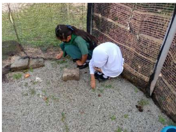
ภาพที่ ๕ กำจัดวัชพืชในแปลงบอนสี