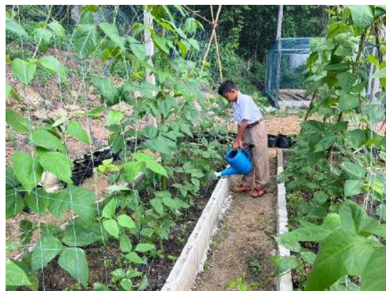
ภาพที่ ๒ รดน้ำผักสวนครัว