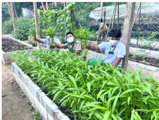
ภาพที่ ๑ เก็บผักบุ้ง