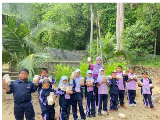
ภาพที่ ๕ รับก้อนเชื้อเห็ดนางฟ้า จากศูนย์ศึกษาการพัฒนาพิกุลทองฯ