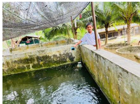
ภาพที่ ๖ ให้อาหารปลาตุ๊ก