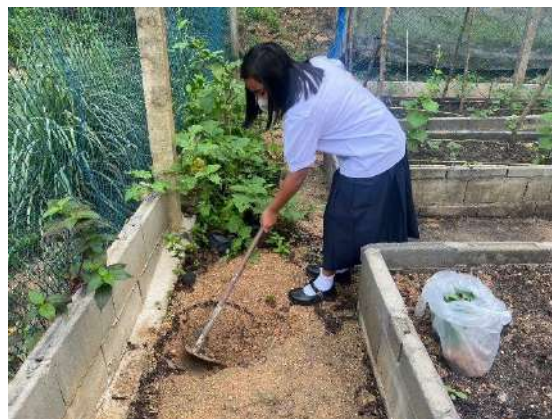
ภาพที่ ๒ ปรับปรุงดินเพื่อปลูกมะละกอ