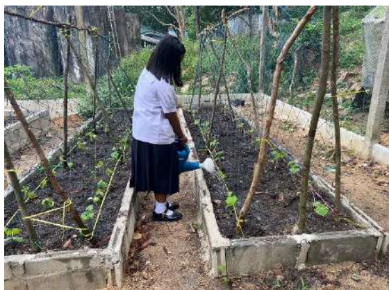
ภาพที่ ๓ รดน้ำผักสวนครัว