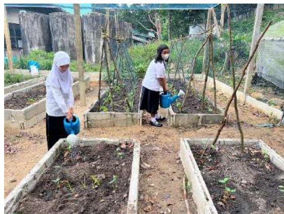
ภาพที่ ๒ รดน้ำผักสวนครัว