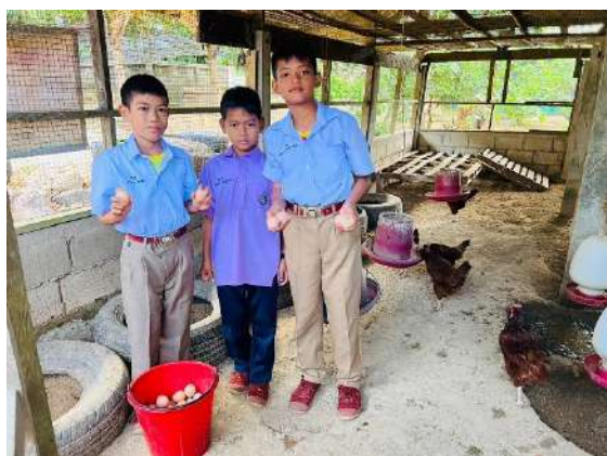
ภาพที่ ๕ เก็บไข่ไก่ เพื่อนำจำหน่ายที่สหกรณ์โรงเรียน