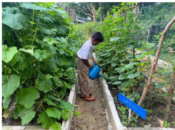
ภาพที่ ๑ รดน้ำผักสวนครัว