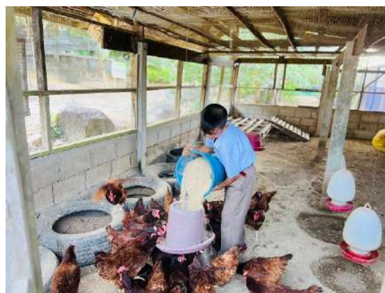
ภาพที่ ๖ ให้น้ำและอาหารไก่ไข่มังกรพระราชทาน