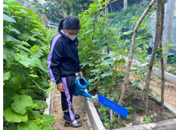
ภาพที่ ๒ รดน้ำผักสวนครัว