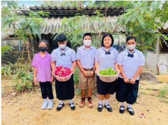
ภาพที่ ๓ นำผลผลิตจำหน่ายผ่านสหกรณ์โรงเรียน