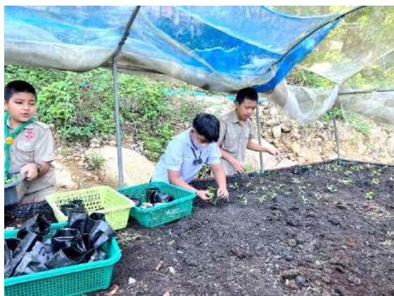
ภาพที่ ๓ ปลูผักยกแคร่