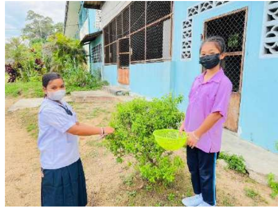
ภาพที่ ๒ เก็บกะเพราจำหน่ายผ่านสหกรณ์โรงเรียน