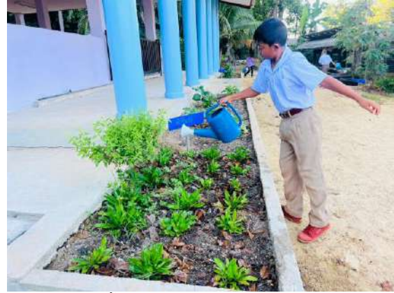
ภาพที่ ๒ รดน้ำผักสวนครัว