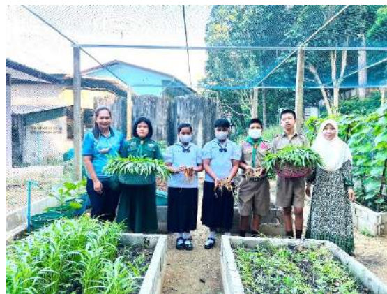
ภาพที่ ๒ เก็บผักบุ้งจำหน่ายผ่านสหกรณ์โรงเรียน