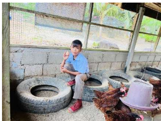
ภาพที่ ๕ เก็บไข่ไก่ เพื่อนำจำหน่ายที่สหกรณ์โรงเรียน