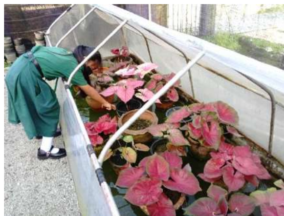
ภาพที่ ๔ กำจัดวัชพืชในแปลงกระถางบอนสี