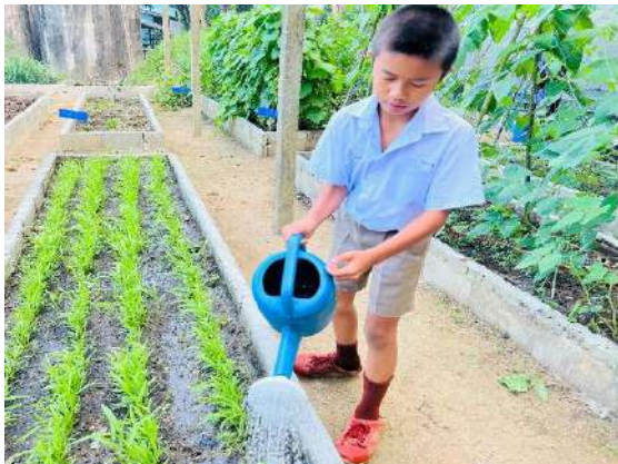
ภาพที่ ๓ รดน้ำผักสวนครัว