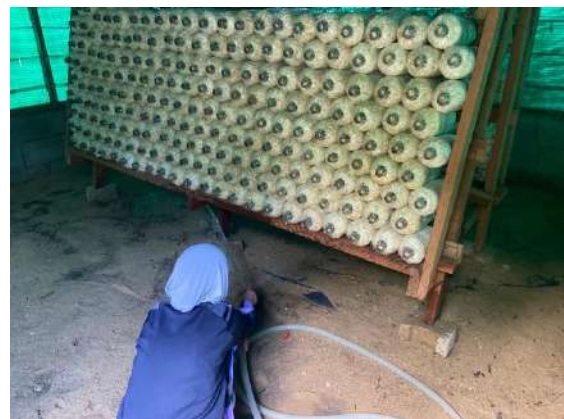
ภาพที่ ๖ รดน้ำพ่นโรงเรือนเพาะเห็ด