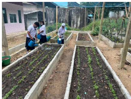
ภาพที่ ๔ รดน้ำผักสวนครัว