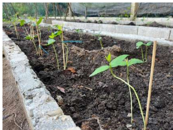
ภาพที่ ๔ ถั้วฝักยาว