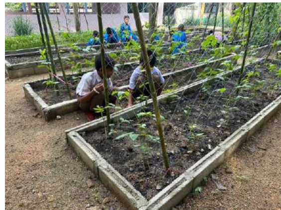
ภาพที่ ๔ กำจัดวัชพืชในแปลงปลูก