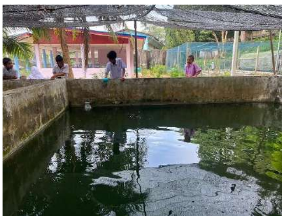
ภาพที่ ๕ ให้อาหารปลา