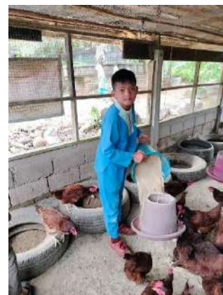
ภาพที่ ๖ ให้น้ำและอาหารไก่ไข่พันธุ์พระราชทาน