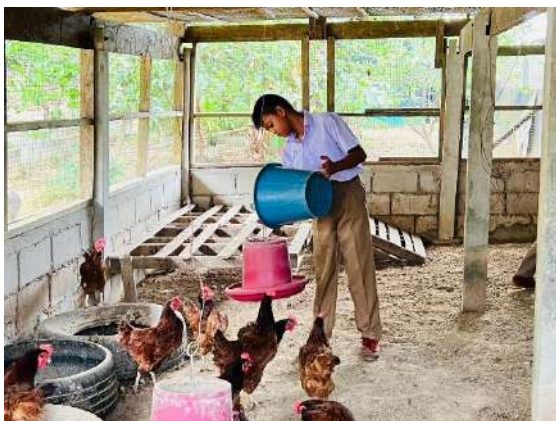
ภาพที่ ๕ ให้น้ำและอาหารไก่ไข่พันธุ์พระราชทาน