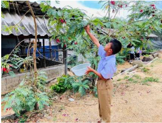
ภาพที่ ๑ เก็บดอกแคจำหน่ายผ่านสหกรณ์โรงเรียน