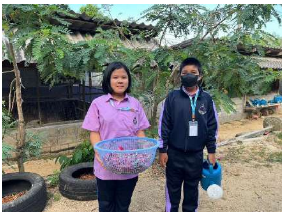
ภาพที่ ๕ เก็บดอกแค