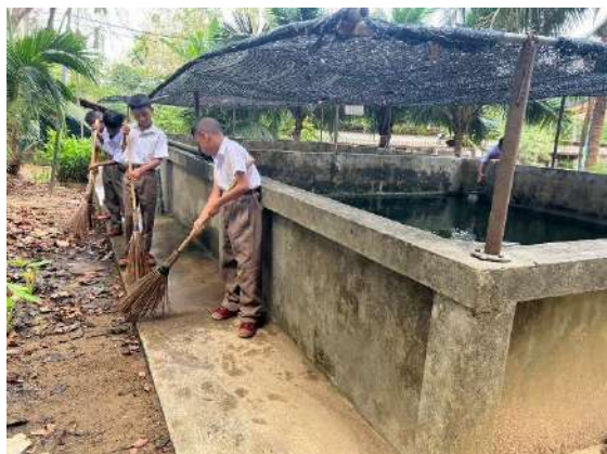
ภาพที่ ๑ กวาดบริเวณรอบบ่อเลี้ยงปลา