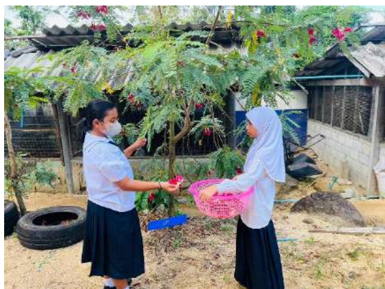
ภาพที่ ๓ เก็บดอกแคจำหน่ายผ่านสหกรณ์โรงเรียน