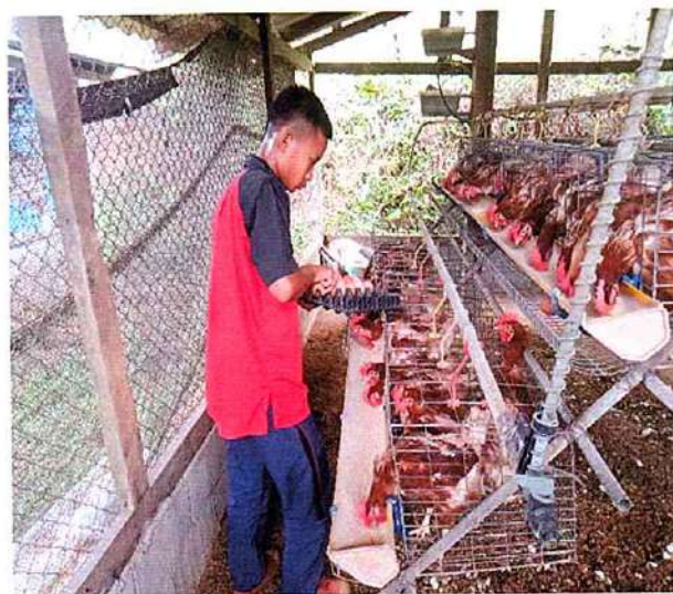
ภาพที่ ๒ กิจกรรมให้อาหารไก่และเก็บไข่ไก่