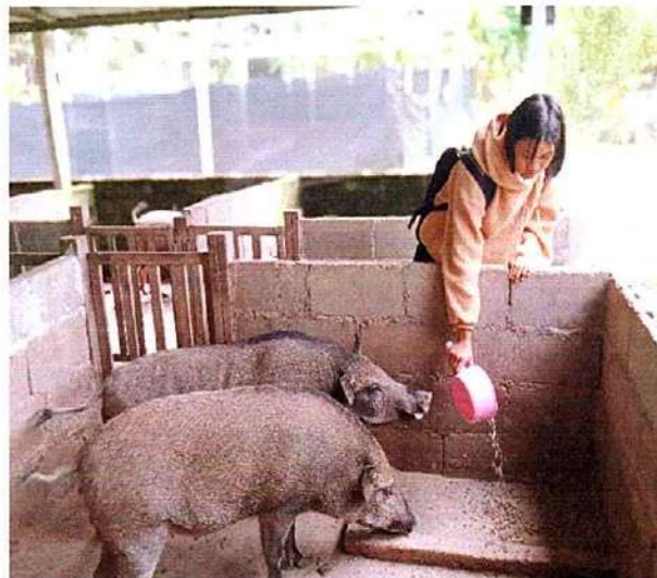
ภาพที่ ๒ กิจกรรมให้อาหารหมู