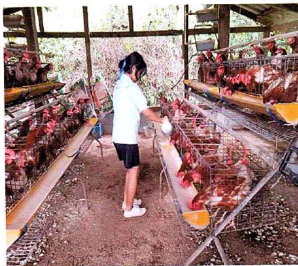
ภาพที่ ๔ กิจกรรมให้อาหารไก่