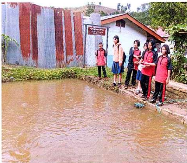
ภาพที่ ๑ กิจกรรมให้อาหารปลา