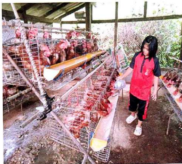
ภาพที่ ๓ กิจกรรมให้อาหารไก่