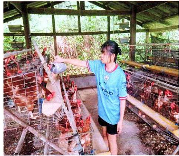
ภาพที่ ๔ กิจกรรมให้อาหารไก่