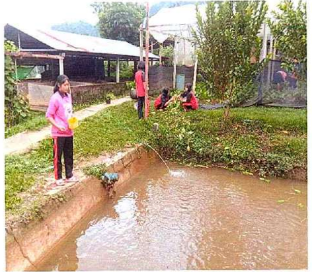
ภาพที่ ๒ กิจกรรมให้อาหารปลา