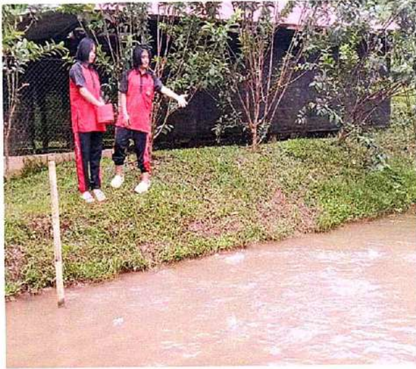
ภาพที่ ๑ กิจกรรมให้อาหารปลา