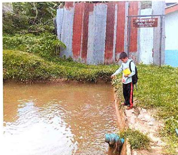
ภาพที่ ๔ กิจกรรมให้อาหารปลา