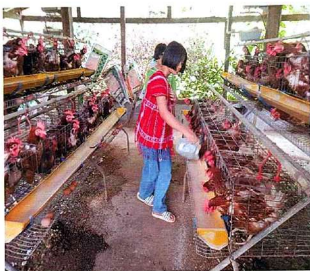
ภาพที่ ๓ กิจกรรมให้อาหารไก่