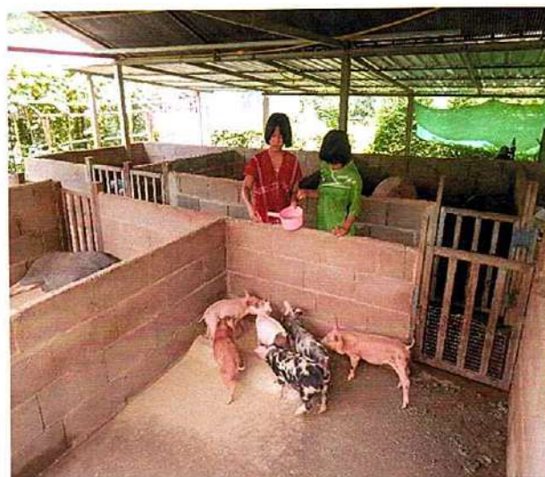
ภาพที่ ๔ กิจกรรมให้อาหารหมู