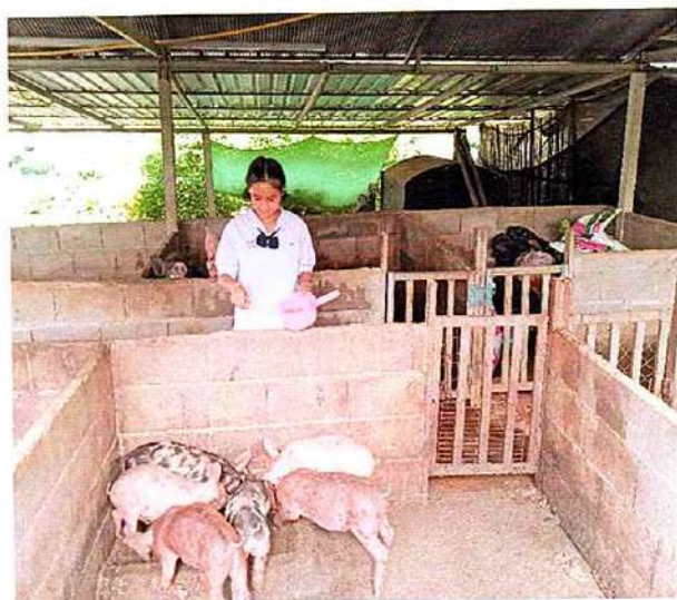
ภาพที่ ๓ กิจกรรมให้อาหารหมู