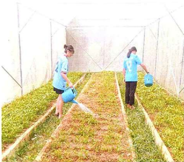
ภาพที่ ๓ กิจกรรมรดน้ำผัก