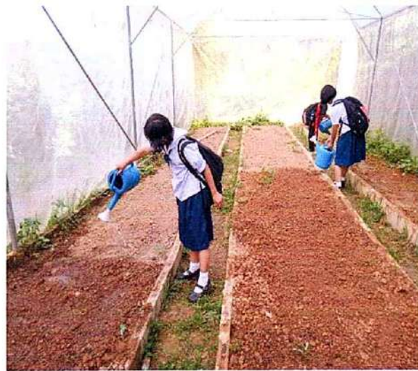
ภาพที่ ๔ กิจกรรมรดน้ำผัก