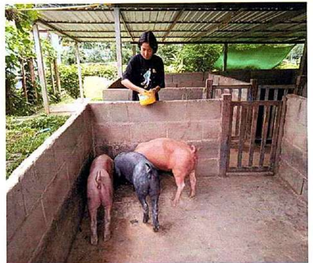
ภาพที่ ๔ กิจกรรมให้อาหารหมู