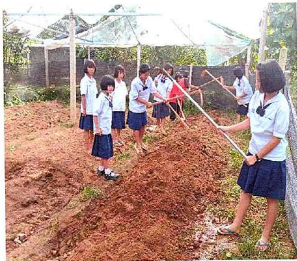
ภาพที่ ๑ กิจกรรมขุดกลับหน้าดิน