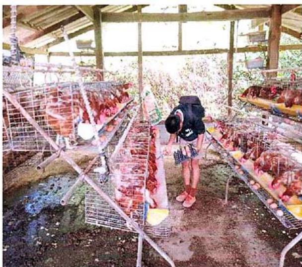
ภาพที่ ๓ กิจกรรมให้อาหารไก่และเก็บไข่ไก่