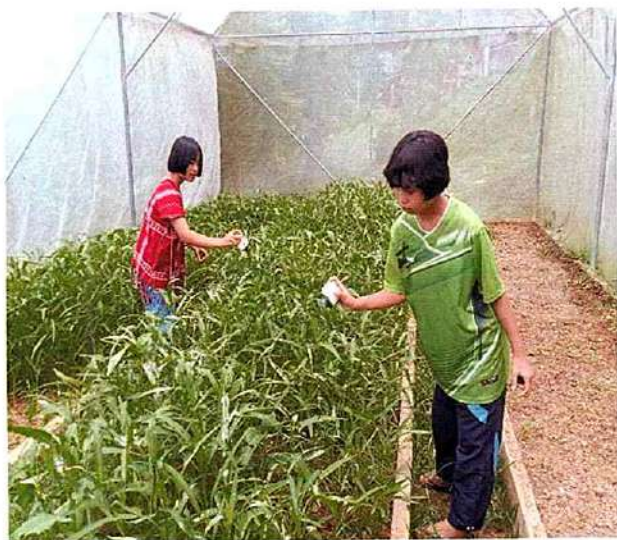
ภาพที่ ๑ กิจกรรมใส่ยาป้องกันมด