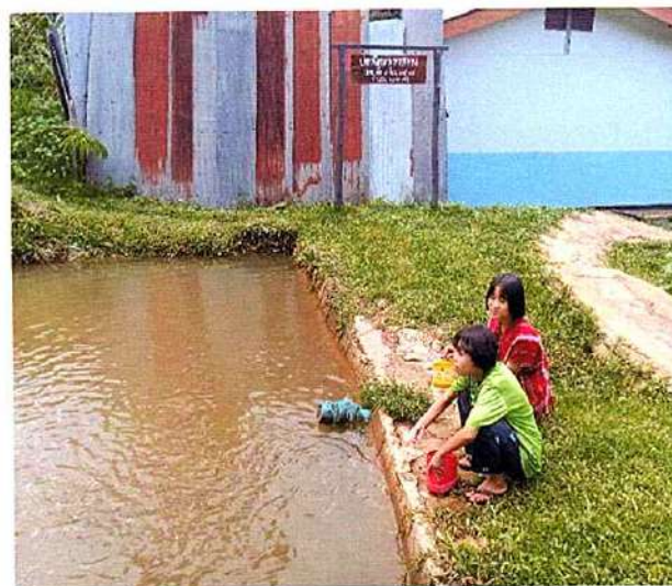
ภาพที่ ๒ กิจกรรมให้อาหารปลา