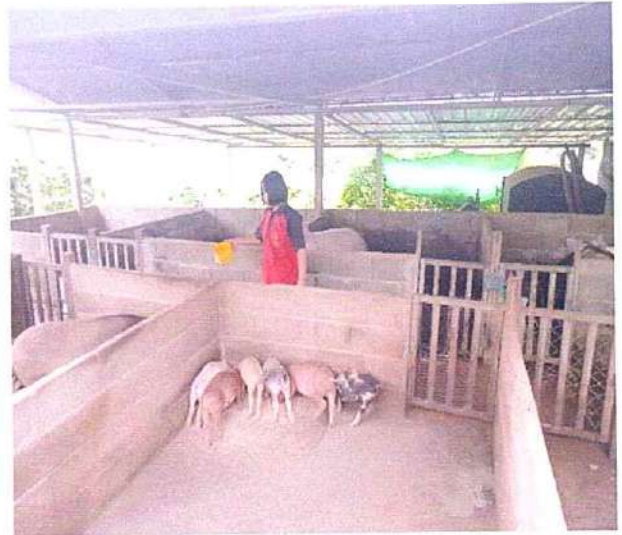
ภาพที่ ๒ กิจกรรมให้อาหารหมู