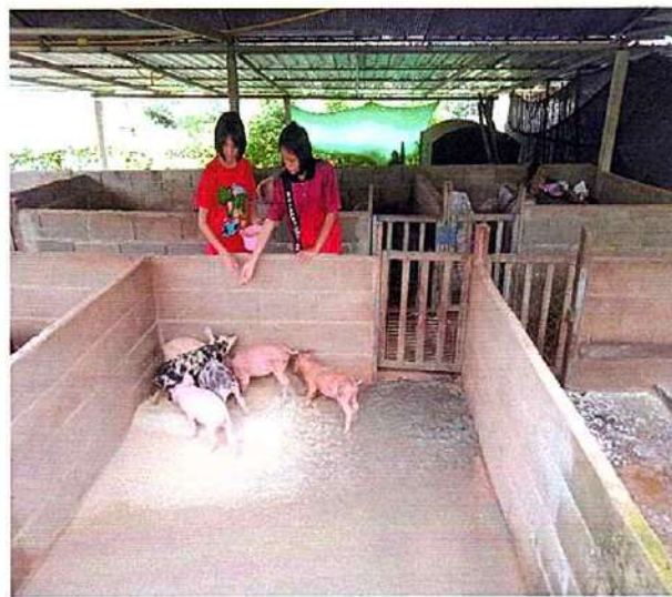
ภาพที่ ๒ กิจกรรมให้อาหารหมู