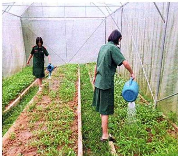
ภาพที่ ๔ กิจกรรมรดน้ำผัก