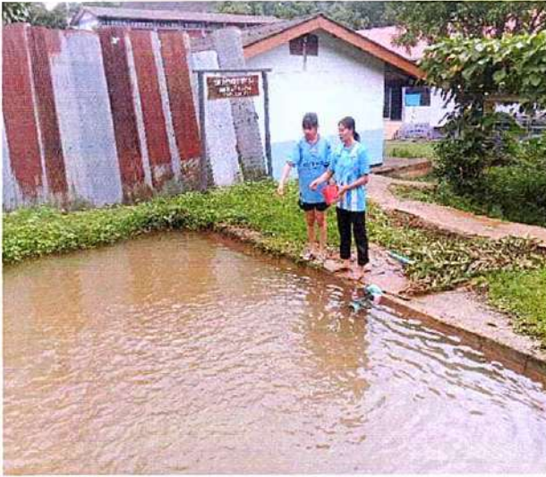
ภาพที่ ๑ กิจกรรมให้อาหารปลา