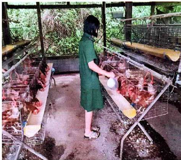
ภาพที่ ๒ กิจกรรมให้อาหารไก่