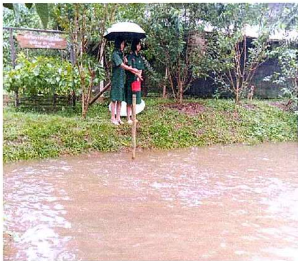
ภาพที่ ๑ กิจกรรมให้อาหารปลา