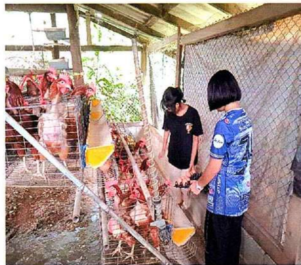
ภาพที่ ๓ กิจกรรมให้อาหารไก่และเก็บไข่ไก่