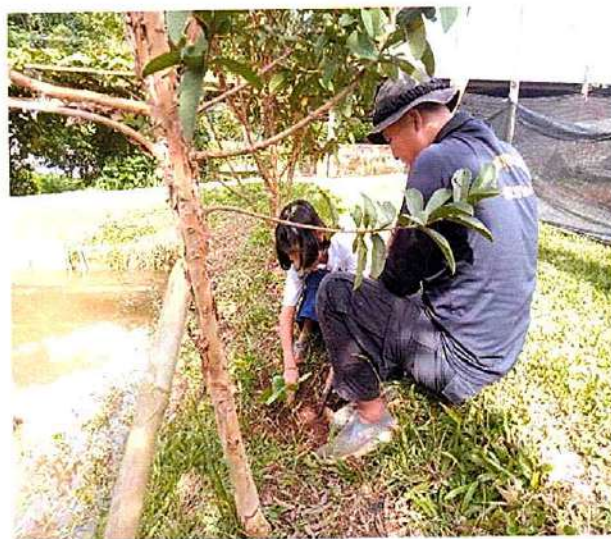
ภาพที่ ๒ กิจกรรมปลูกพริกและมะเขือ