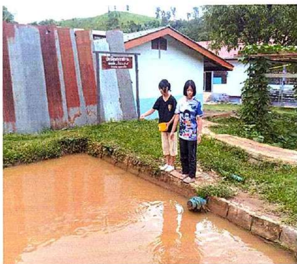
ภาพที่ ๑ กิจกรรมให้อาหารปลา