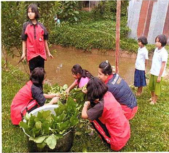
ภาพที่ ๑ กิจกรรมเก็บผักวางตุ้ง