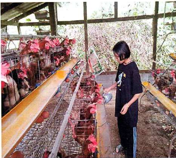
ภาพที่ ๓ กิจกรรมให้อาหารไก่