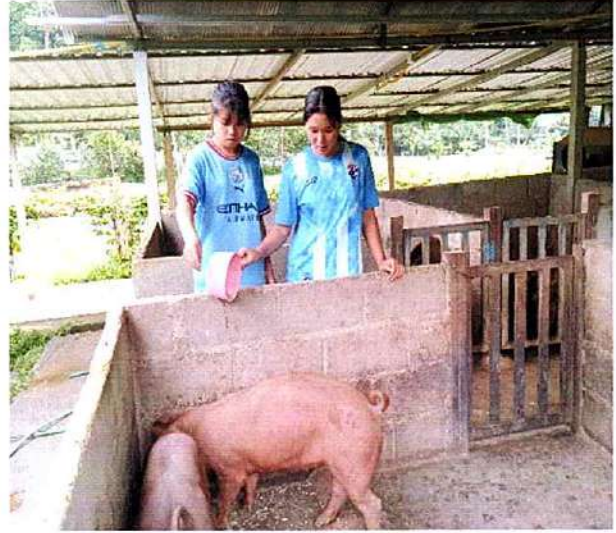
ภาพที่ ๒ กิจกรรมให้อาหารหมู