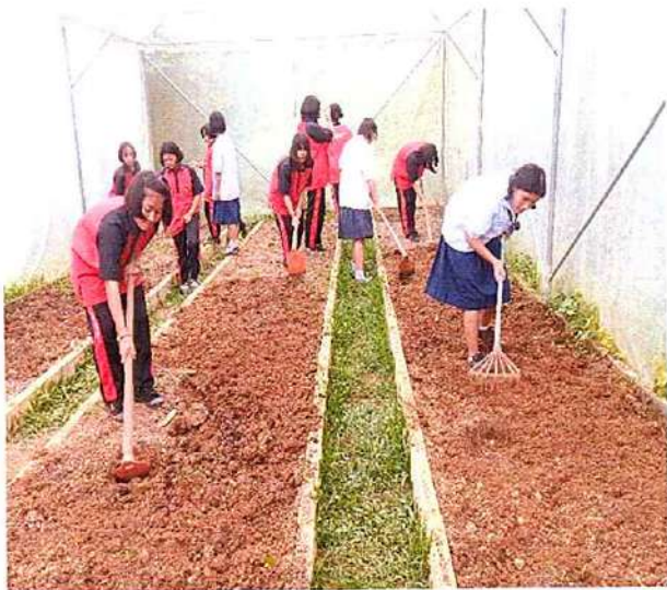
ภาพที่ ๑ กิจกรรมขุดแปลงผัก