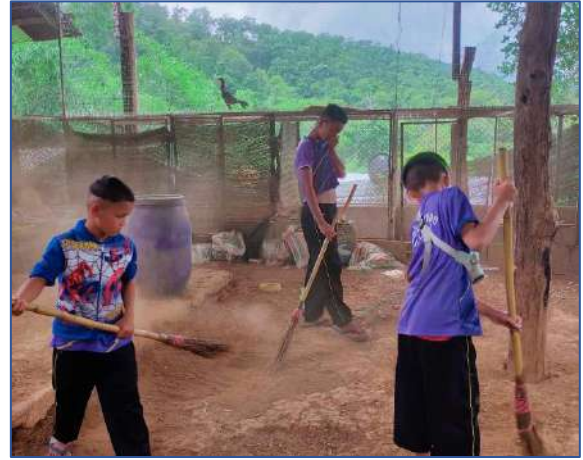
เก็บเศษไม้ และกวาดรอบ ๆ โรงเรือนไก่