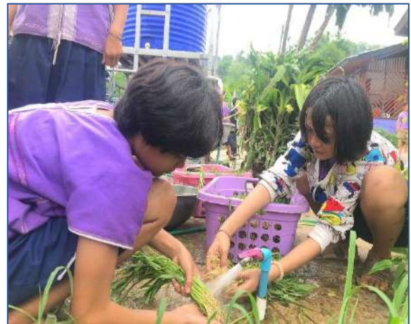
หนูกำลังล้างผักบุ้งก่อนที่จะนำไปซังน้ำหนัขายค่ะ