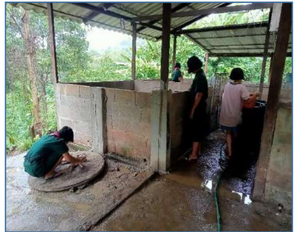
ก่อไฟไล่แมลงในช่วงหน้าฝน