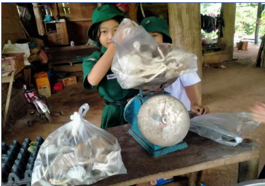
นักเรียนนำเห็ดนางฟ้าที่ช่วยกันเก็บมาชั่งกิโลขาย