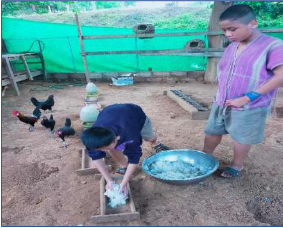
นักเรียนช่วยกันให้อาหารไก่