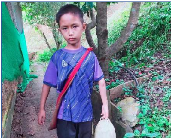
เปลี่ยนน้ำไก่