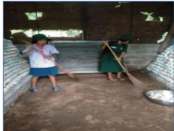
นักเรียนช่วยกันเก็บเห็ดนางฟ้า