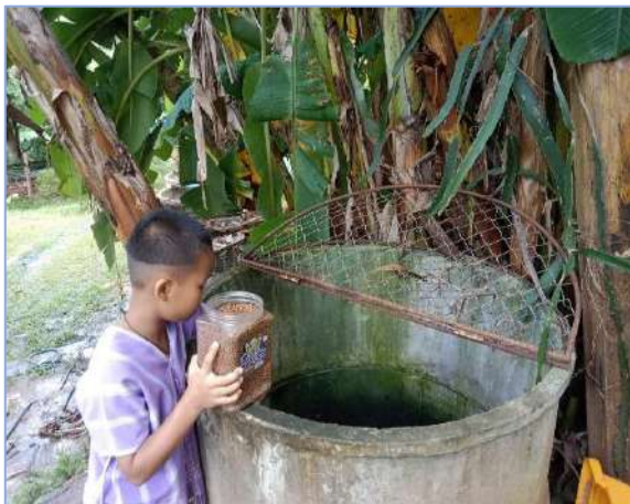
ผมกำลังให้อาหารกบครับ