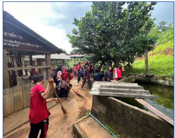
นักเรียนช่วยกันเก็บกวาดและเก็บใบไม้