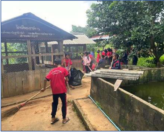
นักเรียนช่วยกันเก็บกวาดบริเวณหน้าบ่อปลา