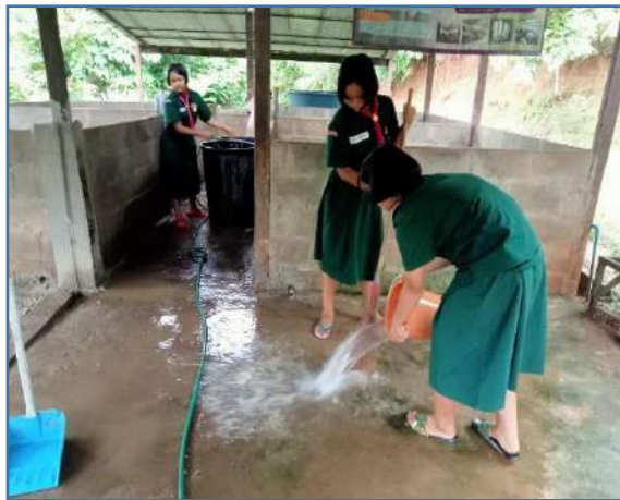
ทำความสะอาดลานผสมอาหาร