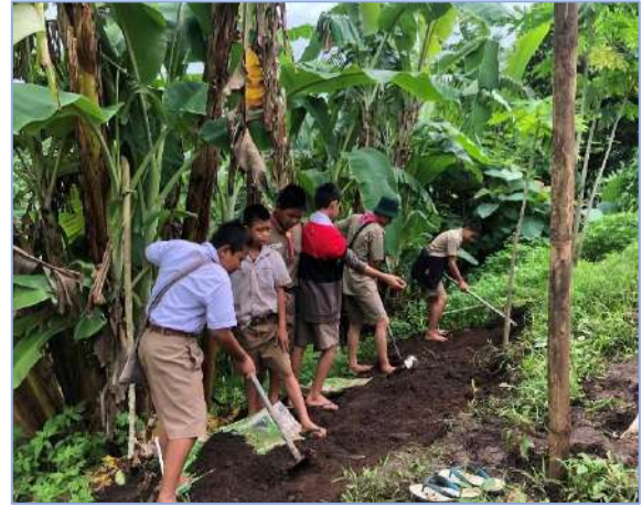
ผมได้อธิบายประเภทดินครับ