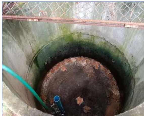
ล้างบ่อกบครับ