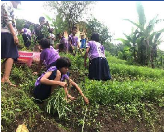
หนูเก็บผักบุ้งแปลงที่สามค่ะ