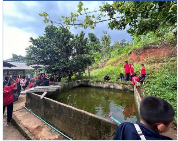
นักเรียนช่วยกันเก็บกวาดบริเวณรอบ ๆ บ่อปลา