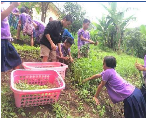
เพื่อนๆกลุ่มอื่นมาช่วยเก็บด้วยค่ะ