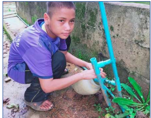
ล้างที่ให้อาหารไก่