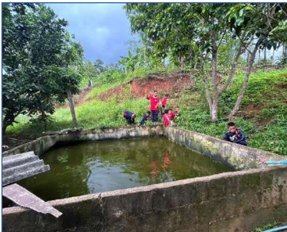
นักเรียนช่วยกันถอนหญ้ารอบบ่อปลา