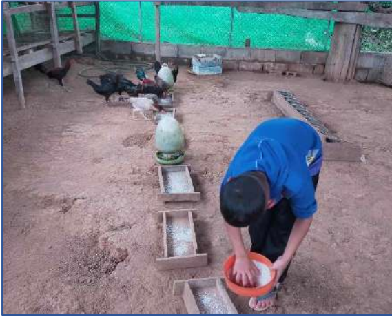
นักเรียนช่วยกันให้อาหารไก่