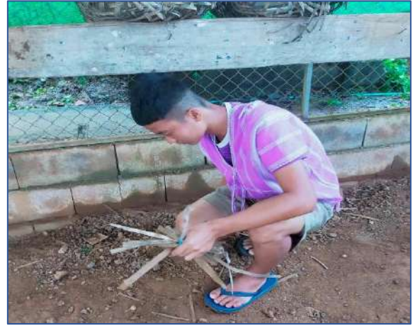
เก็บเศษไม้ และขยะรอบ ๆ โรงเรือนไก่