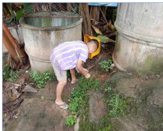
ผมถอนหญ้ารอบๆบ่อกบครับ