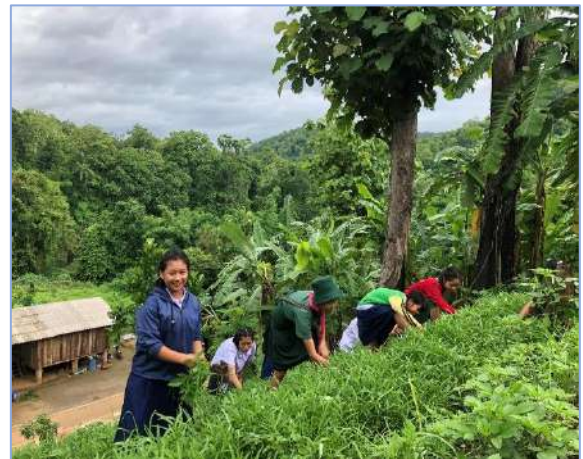
ผักของผมขึ้นสวยมากเลยครับ