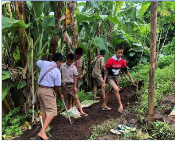
เพื่อนๆ ช่วยกันขึ้นแปลงใหม่ครับ