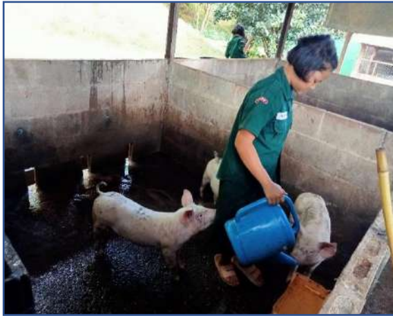
ให้สุกรได้กินน้ำ