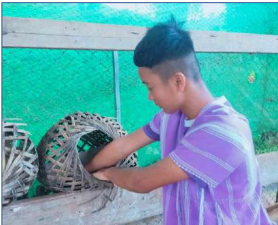
ซ่อมที่ฟักไก่สำหรับแม่ไก่