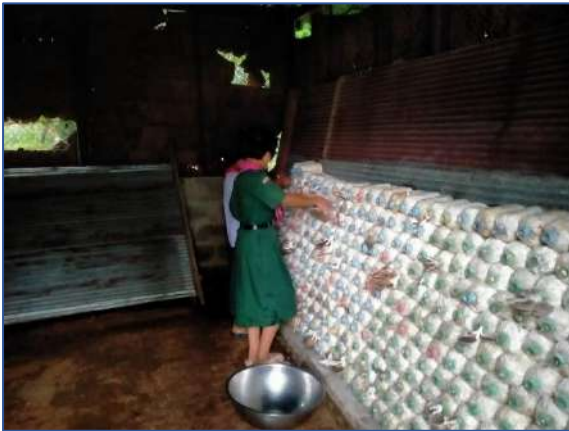
นักเรียนช่วยกันทำความสะอาดโรงเรือน

ภาพประกอบการบันทึกประจำวันโครงการเกษตรเพื่ออาหารกลางวัน กิจกรรมการเพาะเห็ดนางฟ้า