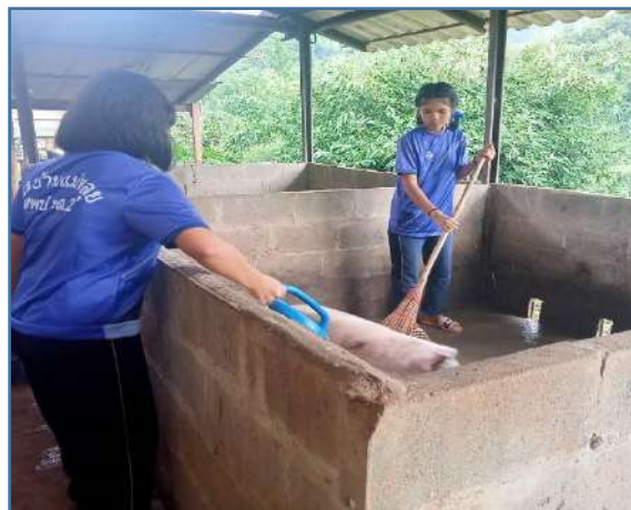
คุณครูผสม EM ให้พวกเรารดคอกสุกรลดกลิ่นไม่พึงประสงค์ พวกเราช่วยกันทำความสะอาดคอกสุกร