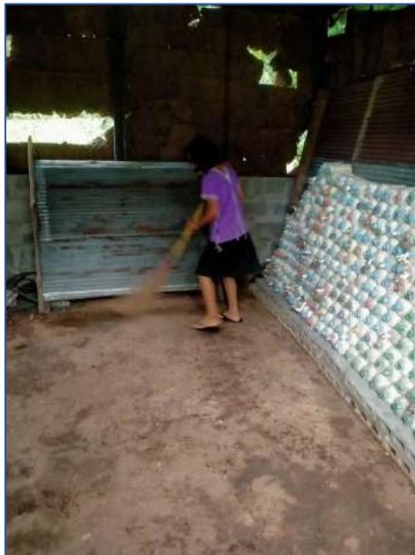
นักเรียนช่วยกันทำความสะอาดโรงเรือน