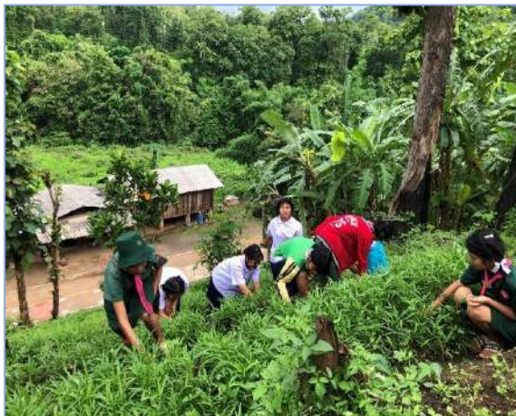
เพื่อน ๆ มาช่วยผมถอนหญ้าที่แปลงผักบั้งครับ