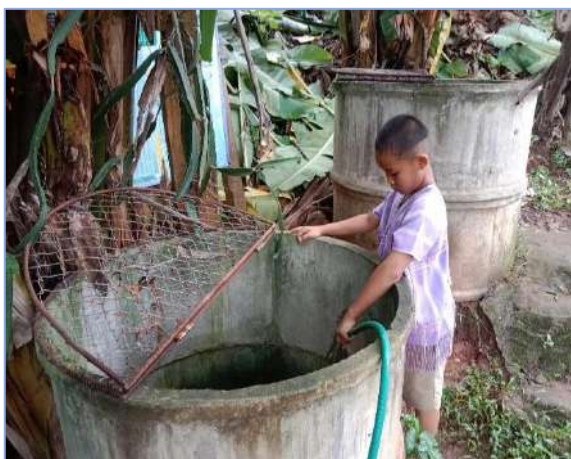
ผมเติมน้ำให้บ่อครับ