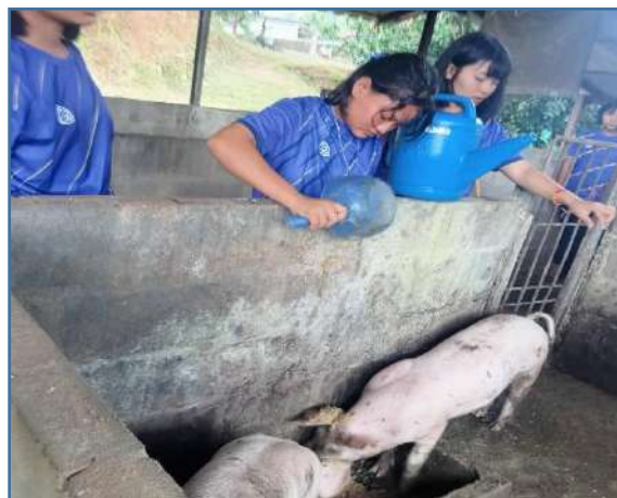
แช่อาหารสำเร็จรูป และเตรียมอาหารให้สุกร