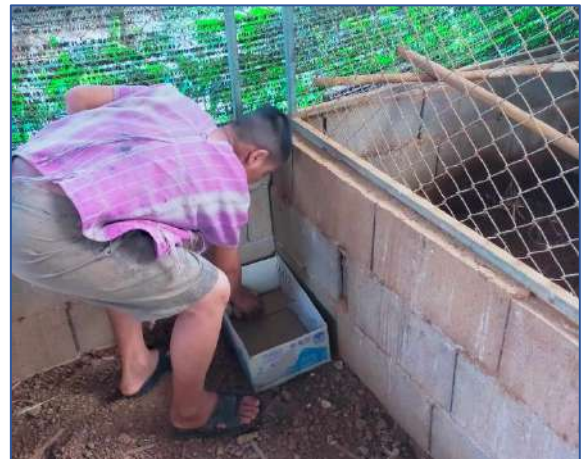
ย้ายไก่ที่ฟักนำมาใส่กล่องให้แม่ไก่ฟัก