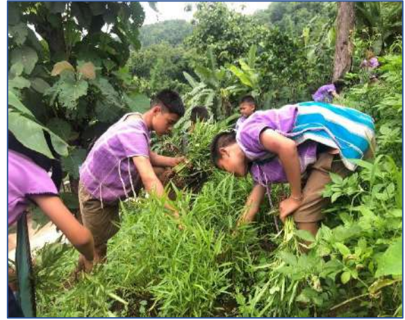
กลุ่มผักของหนูช่วยกันเก็บผักบุ้งค่ะ