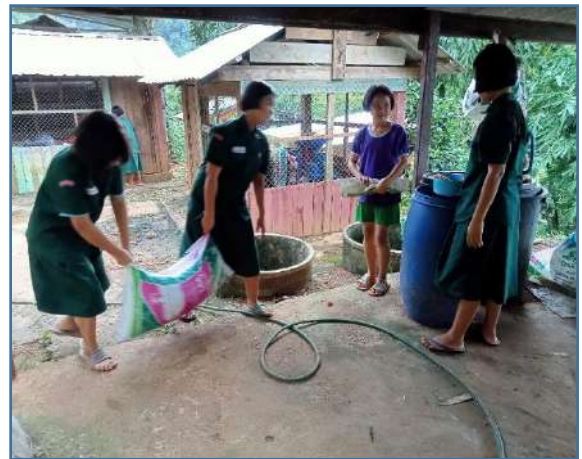
ช่วยกันแบกอาหารสำเร็จรูปใส่ถังดำให้เต็ม