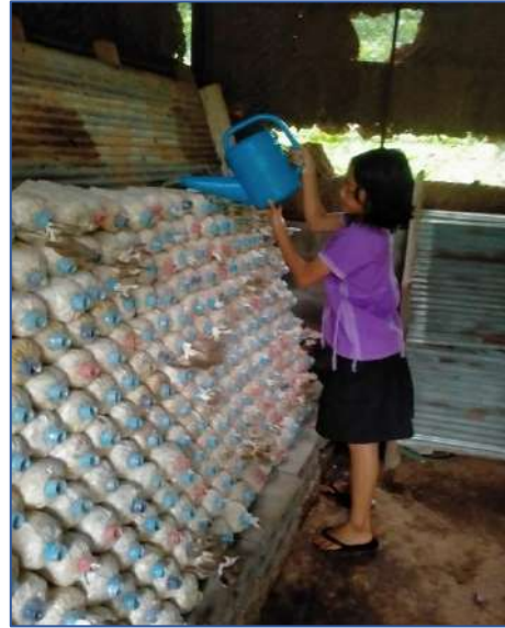
นักเรียนช่วยกันรดน้ำก้อนเห็ดนางฟ้า