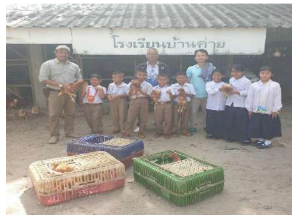
เจ้าหน้าที่ปศุสัตว์จังหวัดมอพบพันธุ์ไก่ไข่ ๒๐ ตัว