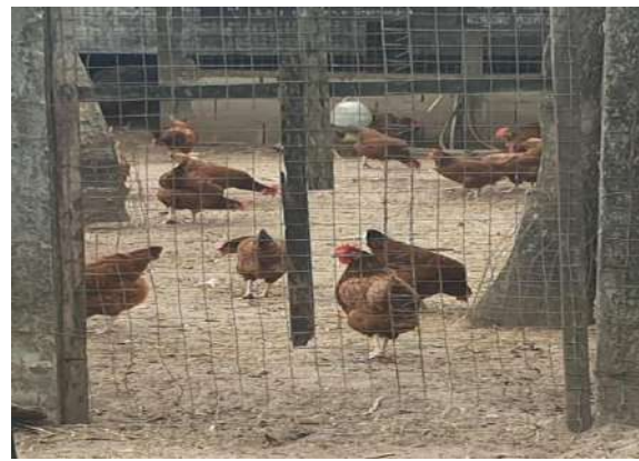
ไก่ออกมาคุ้ยเขี่ยดินหาอาหารกิน