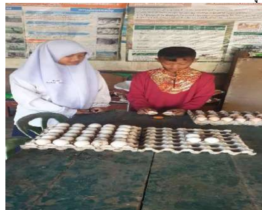
ไก่ที่เลี้ยงจะมีเปลือกไข่สีเหลืองขาวบางแตกง่าย