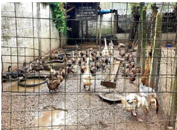
กิจกรรมเลี้ยงเป็ดไข่