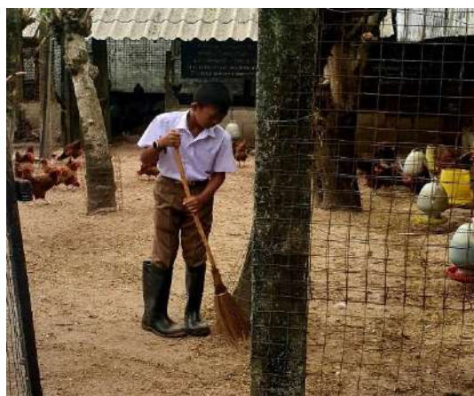
ใช้น้ำฉีดพื้นดินบริเวณลานปล่อยสัตว์เพื่อลดฝุ่น