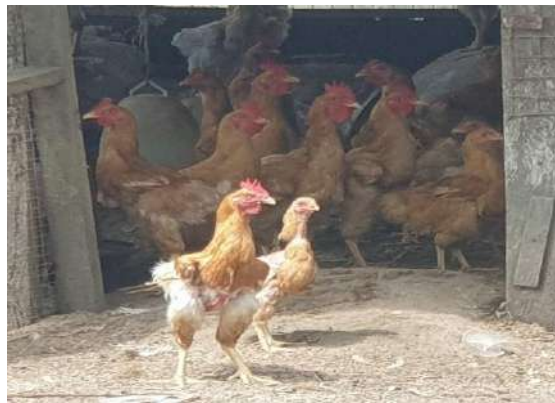
กิจกรรมเลี้ยงไก่เบตง