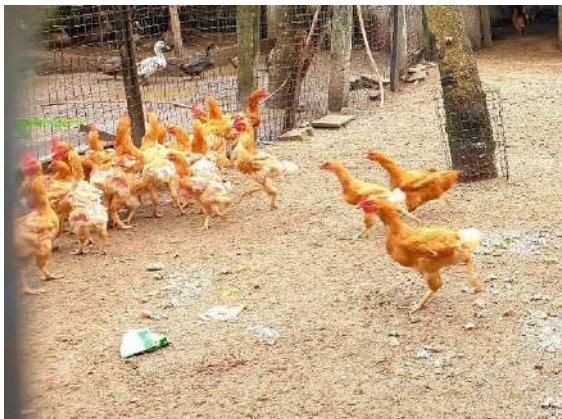
มีเศษกระดูกและห่อขนมที่ติดมากับเศษอาหาร