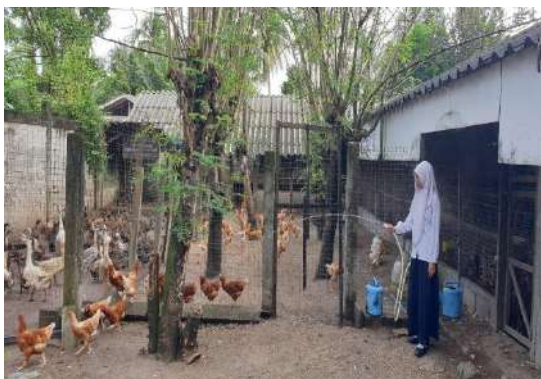
ใช้น้ำฉีดพื้นดินบริเวณลานปล่อยสัตว์เพื่อลดฝุ่น