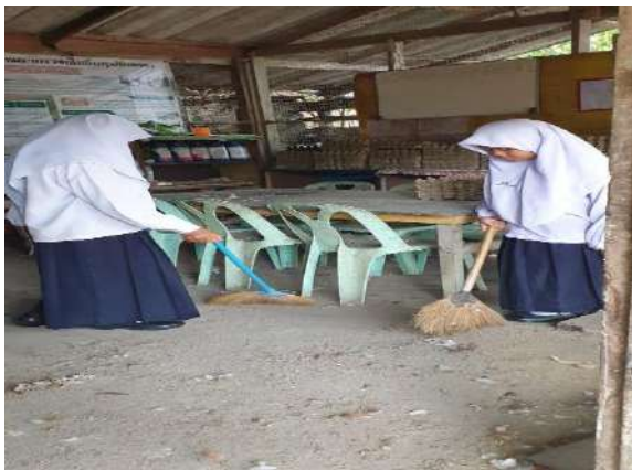
ทำความสะอาดห้องเก็บอุปกรณ์และที่เก็บไข่