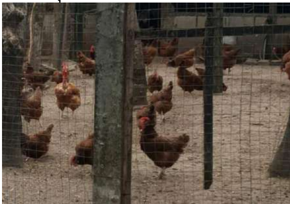
กิจกรรมเลี้ยงไก่ไข่