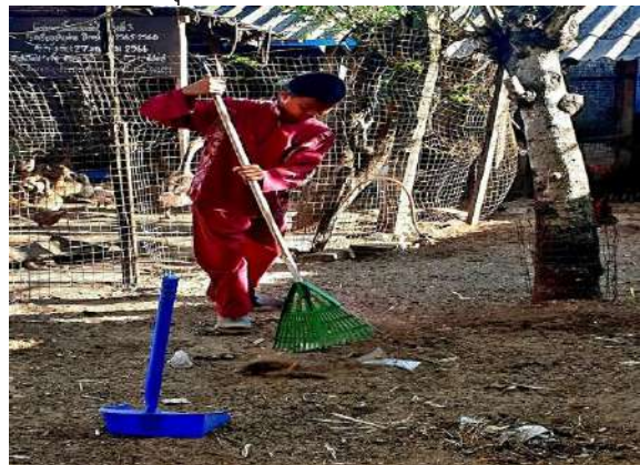
นักเรียนช่วยกันกวาดนำเศษอาหารไปทิ้งในถังขยะ