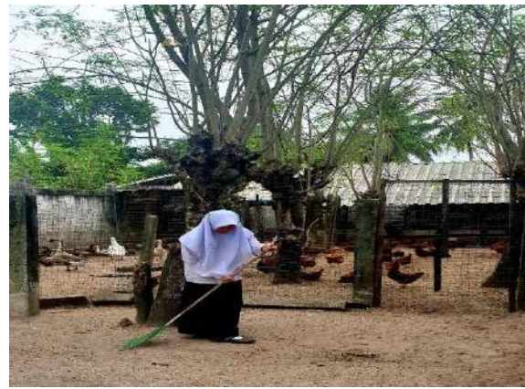
ทำความสะอาดบริเวณลานปล่อยสัตว์