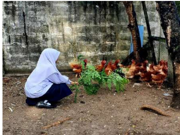
ใบมะรุมนสามารถเก็บให้สัตว์กินได้ด้วย