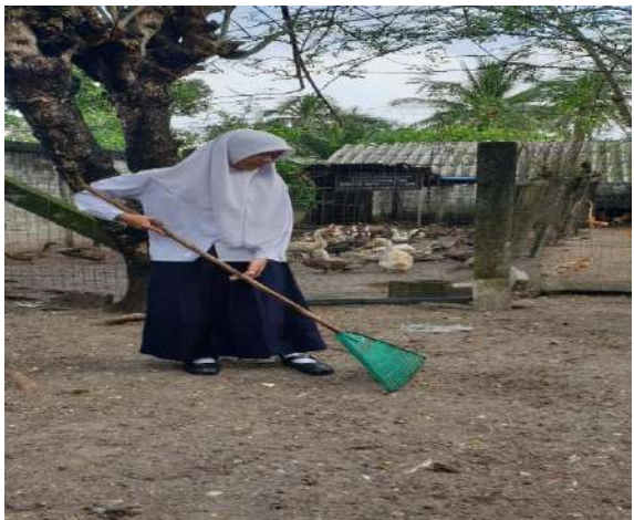
ทำความสะอาดบริเวณที่เลี้ยงสัตว์