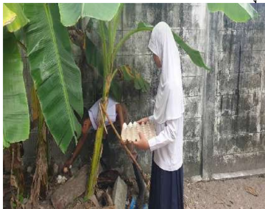
ไก่มันมานอนเล่นที่กอดต้นกล้วยและแอบไข่