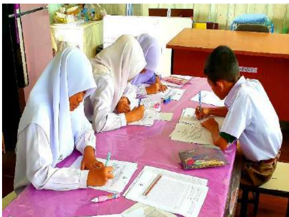
นักเรียนปรึกษากันและเขียนบันทึกรายงาน