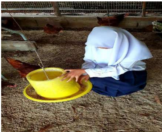
นักเรียนช่วยกันให้น้ำและอาหารสัตว์