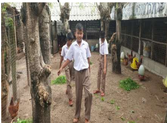
เก็บใบไม้ให้ไก่กินเพื่อเสริมโปรตีนให้ไก่