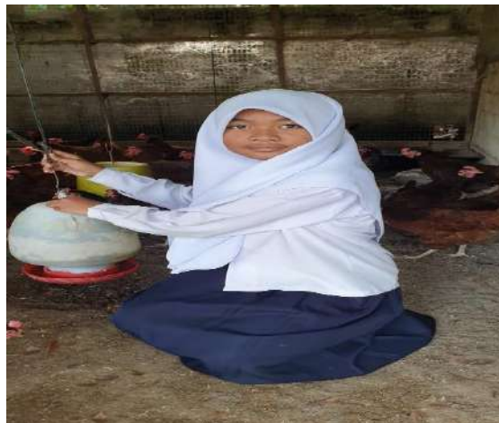
ให้น้ำและอาหารสัตว์