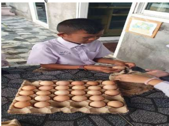
นักเรียนช่วยกันทำความสะอาดไข่ที่เก็บได้