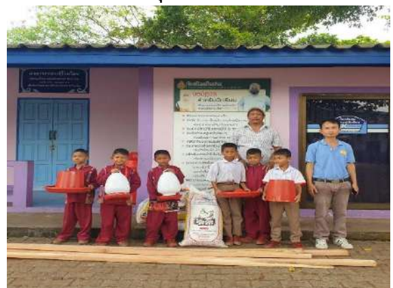
เจ้าหน้าที่ปศุสัตว์จังหวัดมอบอุปกรณ์เลี้ยงไก่