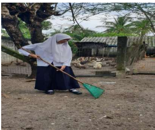
ช่วยกันทำความสะอาดเล้าไก่และเล้าเป็ด