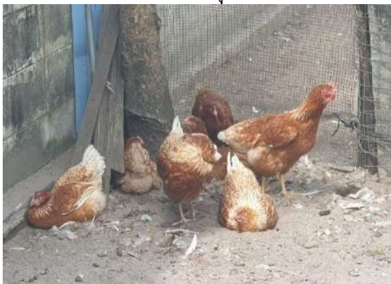
ไก่ออกมาคุ้ยเขี่ยดินแล้วนอนตากแดด