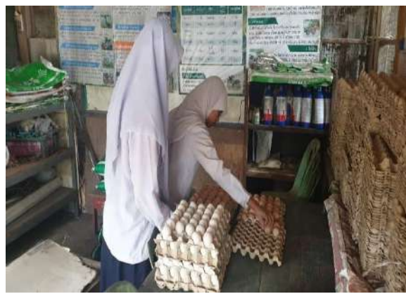
นักเรียนนำไข่ที่เก็บได้ไปเก็บที่ห้องเก็บไข่