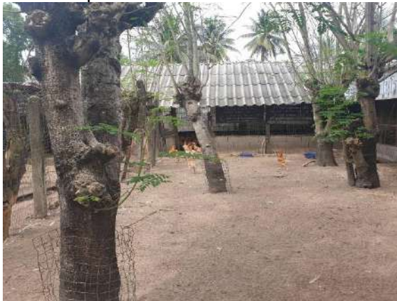
ต้นมะรุมนที่ปลูกในเล้าไก่สามารถเป็นเงาให้สัตว์หลบร้อน