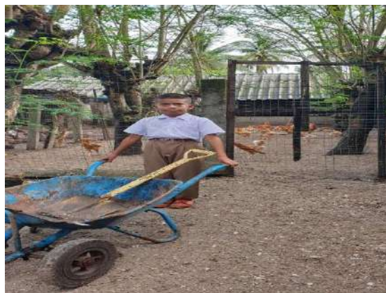
ทำความสะอาดบริเวณที่เลี้ยงสัตว์