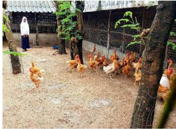
ไก่พื้นเมืองเบตงเหลือ จำนวน ๔๘ ตัว