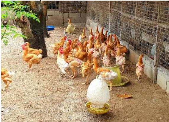
ไก่พื้นเมืองเบตงเริ่มเลี้ยง จำนวน ๕๐ ตัว