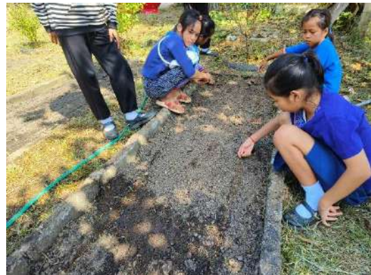
ภาพที่ ๔ โรยเมล็ดและกลบร่อง