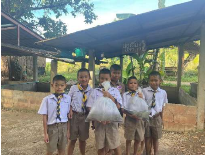
ภาพที่ ๑ พันธุ์ปลาดุก ๓๐๐ ตัว