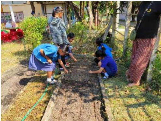
ภาพที่ ๓ โรยเมล็ดผักบุ้ง