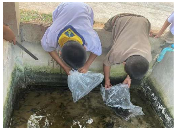
ภาพที่ ๔ เติมน้ำลงบ่อให้พอเหมาะสำหรับพันธุ์ปลา