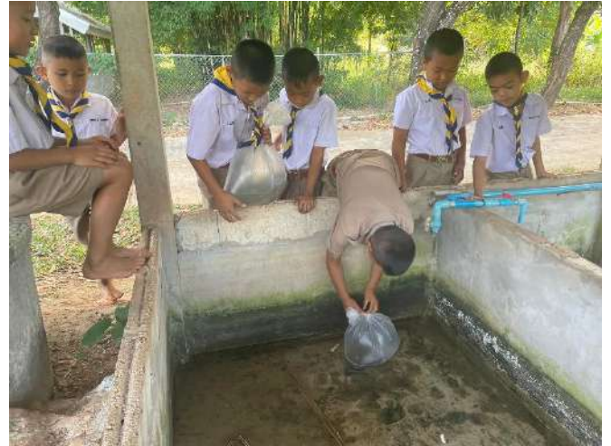
ภาพที่ ๒ นำไปที่บ่อที่เตรียมไว้