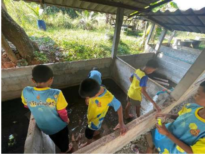
ภาพที่ ๑ ล้างทำความสะอาดบ่อ เตรียมบ่อปลา