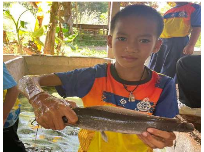
ภาพที่ ๔ แยกขนาดของปลาตุ๊ก