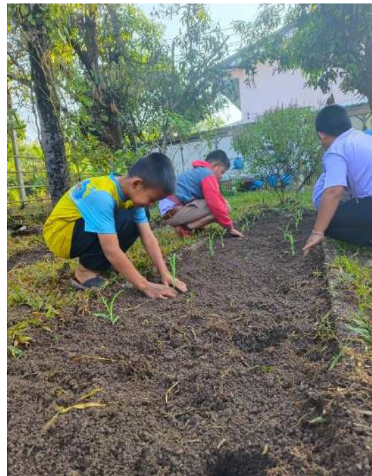
ภาพที่ ๔ นำต้นกล้าลงปลูกที่แปลง