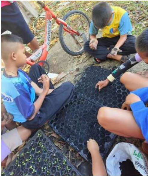
ภาพที่ ๑ นักเรียนช่วยกันเตรียมเพาะเมล็ด