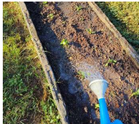
ภาพที่ ๖ รดน้ำกะหล่ำปลี