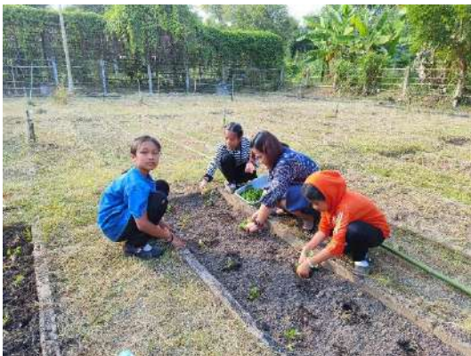
ภาพที่ ๕ ปลุกต้นกล้ากะหล่ำปลี