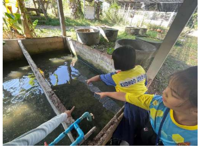
ภาพที่ ๒ สำนวขนาดปลาในบ่อ