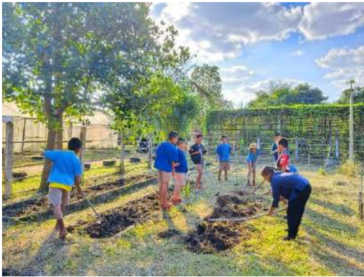
ภาพที่ ๑ ขุดดินเตรียมแปลง