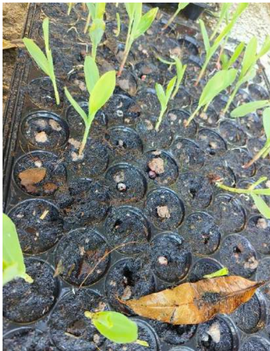
ภาพที่ ๓ ต้นกล้าข้าวโพด