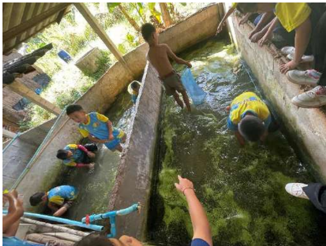
ภาพที่ ๓ ลงบ่อ เพื่อจับปลา