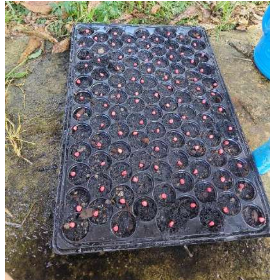
ภาพที่ ๒ เมล็ดข้าวโพดในถาดเพาะ