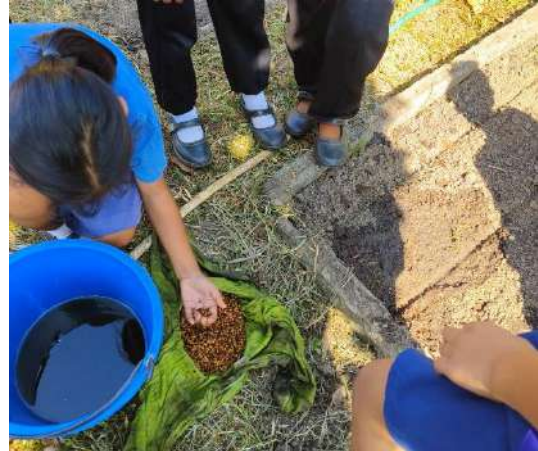
ภาพที่ ๒ เมล็ดผักบุ้งแช่น้ำ ๑ คืน