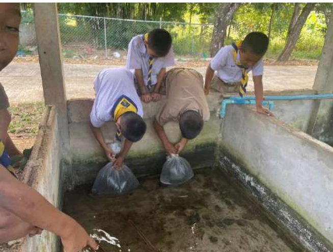
ภาพที่ ๓ ปล่อยพันธุ์ปลาดุกลงบ่อที่เตรียมไว้